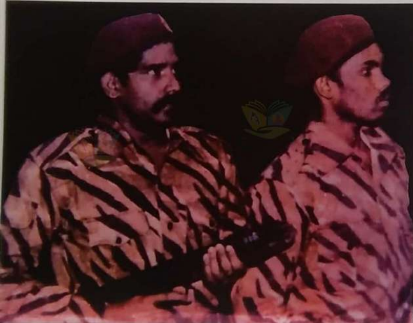
சீலனுடன் புலேந்தி அம்மான்

மே 18 ஆம் திகதி, தேர்தல் நிலையங்களின் பாதுகாப்பு பந்தோபஸ்து கருதி சிறீலங்கா அரசு யாழ். குடாநாடு முழுவதும் ஆயுதப்படைகளைக் குவித்தது. ஒவ்வொரு தேர்தல் வாக்களிப்பு நிலையத்திற்கும் விரிவான பாதுகாப்பு நடவடிக்கைகள் மேற்கொள்ளப்பட்டிருந்தன.