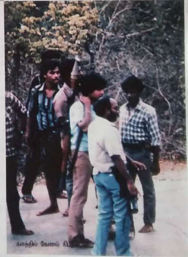
கனத்தில் கேணல் கி...

புலிகள் வெள்ளேறு திசைகளால் பின்வாங்கினார்கள். அல்லது தப்பி ஓடினார்கள்.