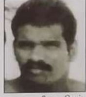
2வது லெப. ரெஜினோஸ்