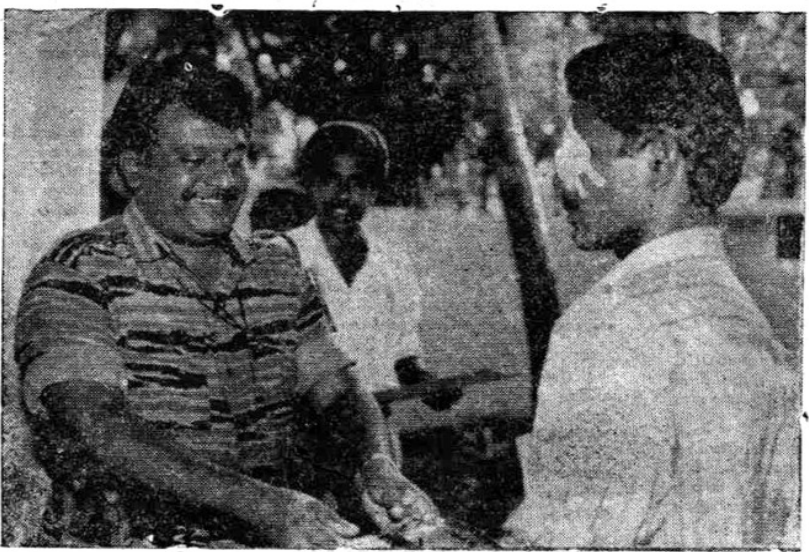
வெற்றிகரமான கட்டுப்பாட்டைப் படைமுகாம் தகர்ப்பில், திறம்படச் செடற்பட்ட போராளிகளைத் தலைவர் அவர்கள் கௌரவித்துப் பரிசளித்தபோது.

ஒருமுறை, இவரைச் சந்தித்துவிட்டு யாழ்ப்பாணம் வரவிருந்த ஒரு பிரான்சு