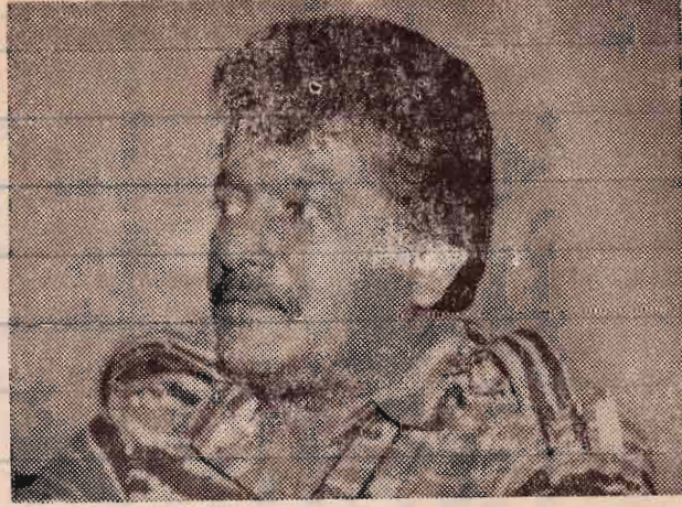
தமிழீழத் தேசியத் தலைவர் திரு. வே. பிரபாகரன் அவர்கள்

எமது சமூகம் மாறிக்கொண்டிருக்கிறது. விடுதலைப் போராகவிசிக் கொண்டிருக்கும் வரலாற்றுப் புயல் எமது மண்ணில் காலம்காலமாக நிலைத்திருந்த பழைமைவாத விருட்சங்களை வேரோடு பிடுங்கி வீழ்த்தி வருகிறது. எமது மனக்குகையில் குடியிருந்த மூடநம்பிக்கைப் பேய்கள் விரட்டப்பட்டு வருகின்றன. எமது சமூகக் கருத்துலகில் புதியபார்வை மலர்கிறது. புதிய விழிப்புணர்வு தோன்றி வருகிறது. சமூக உறவுகளில் புரட்சிகரமான மாற்றம் நிகழ்ந்து கொண்டிருக்கிறது.