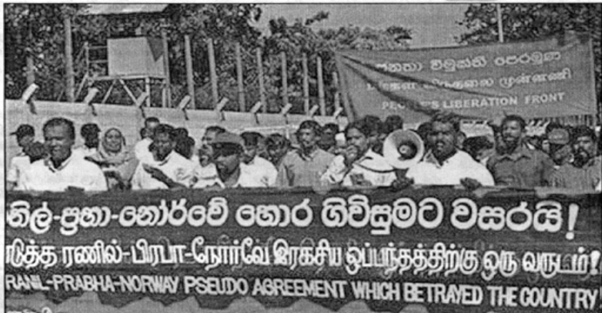
வெ-சுல-கைரீலே கைரீ விசுரீ! மீத்த ரணில்-பிரபா-நோர்வே கிரகசிய ஒப்பந்தத்திற்கு ஒரு வருடம்! RANL-PRABHA-NORWAY PSEUDO AGREEMENT WHICH BETRAYED THE COUNTRY!

தமிழ்மக்கள் மட்டுமன்றி சிங்கள மக்களும் உயர்கோடவிற்கு நன்றிமுடையவர்களாக இருக்கவேண்டும். அவரது செவ்வியல் சில ஒளிக்கீற்றங்கள் வருமான, “சிங்களத் தேசிய வாழ் முன்னோக்கிப் பார்க்கும் ஒன்றும். யூனிடோடு அறிதல் பற்றிய அச்ச உணர்வி தேவான அது தங்கி நிற்கின்றது— தமிழர் பிரச்சினையை ஒரு சிறுபான்மையே பிரச்சினையாக சிங்கள ஆளும் வர்க்கம் இன்னமும் பாதிப்பதற்கு சிங்களம் என நினைக்கின்றோம். போரிடும் பிரிவு ஆகட்டும் சனாதிபதி சந்திரிகா ஆகட்டும் அவர்கள் தமிழ்மக்கள் பிரச்சினையை ஒரு சிறுபான்மையினரின்