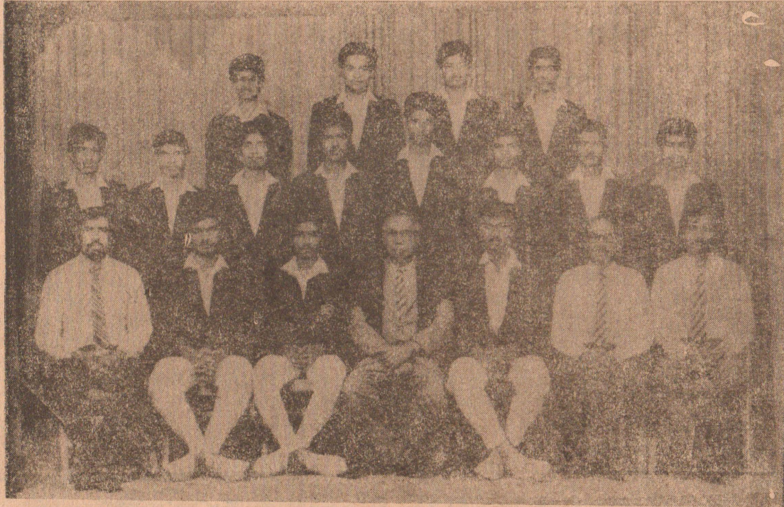
யாழ். சென்ஜோன்ஸ் கல்லூரி கிரிக்கெட் அணி

யாழ்ப்பாணம் செஞ்சிலுவைச் சங்கத்தினால் வேலணைப்பகுதி மக்களுக்கு குடிநீர் வழங்குவதற்காக அன்பளிப்பு செய்யப்பட்டபடிசூடன்குடியமினி உழவு இயந்திரத்தின் மூலம் தற்போது ஊர்காவற்றுறை, வேலணை ஆகிய பகுதிகளில் குடிநீர் தட்டுப்பாட்டான இடங்களுக்கு குடிநீர் விநியோகிக்கப்பட்டு வருகின்றது (15)