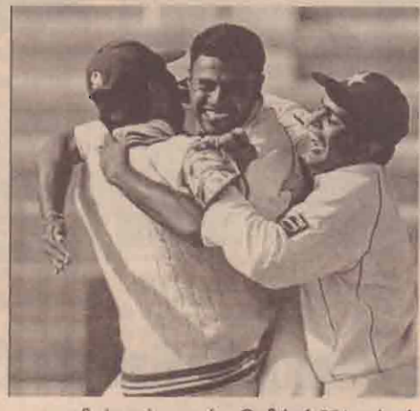
பாகிஸ்தான் முதல் இனிங்ஸ்-274 ஓட்டங்கள். இரண்டாவது இனிங்ஸ் 341 ஓட்டம், இங்கிலாந்து முதல் இனிங்ஸ் 418 ஓட்டங்கள். இரண்டாவது இனிங்ஸ் 175 ஓட்டங்கள்.

வீச்சாளர்கள். சுலமான் இலக்கை இங்கிலாந்து அணி எட்டி விரும் என எதிர்நாக்கப்பட்ட போதும் 175 ஓட்டங்களுக்கு அனைத்து விக்கெட்டுக்களையும் இழந்து 22 ஓட்டங்களால் தோல்வி அடைந்தது. துடுப்பாட்டத்தில் இமன் பெல்31, ஜோன்ஸ் 33 ஓட்டங்களையும், ஸ்ரோஸ் 23 ஓட்டங்களையும் அதிகபட்சமாகப் பெற்றனர். பந்து வீச்சில் கனோயா நான்கு விக்கெட்டுக்களையும், அக்தர் மூன்று விக்கெட்டுக்களையும், சமி இரண்டு விக்கெட்டுக்களையும் கைப்பற்றினர். மேற்படி வெற்றி மூலம் மூன்று போட்டிகள் கொண்ட டெஸ்ட் தொடரை 1-0 என்ற நிலையில் பாகிஸ்தான் முன்னணியில் திகழ்கிறது. போட்டியின் சிறப்பாட்டக்காராக முதல் இனிங்சில் 71 ஓட்டங்களையும், இரண்டாவது இனிங்சில் சதம் அடித்த சல்பாட் தெரிவானார்.