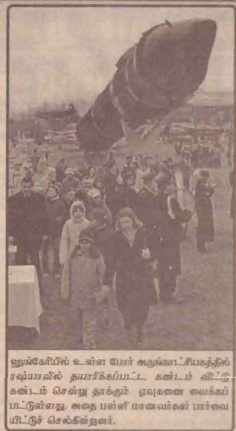
ஹுஸ்கேயில் உள்ள போர் அருங்காட்சியகத்தில் ரஷ்யாவில் தயாரிக்கப்பட்ட கண்டம் விட்டு கண்டம் சென்று தாக்கும் ஏவுகணை வைக்கப் பட்டுள்ளது. அதை பள்ளி மாணவர்கள் மாலை மீட்டுச் செல்கின்றனர்.

புகம்பத்தால் பாதிக்கப்பட்ட மக்களின் மறு வாழ்வுக்கு உதவி செய்யும் போது பாகிஸ்தானில் கல்விச் சீர்திருத்தம் ஏற்பட வழிவகுக்க வேண்டும். அரசியல் சீர்திருத்தம் ஏற்பட வழிவகுக்க வேண்டும். இவ்வாறு அந்த அறிக்கையில் கூறப்பட்டுள்ளது.