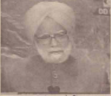
(புதுடில்லி) பாதுகாப்புத் தேவைகளைப் பூர்த்தி செய்வது தொடர்பாக நாட்டின்

தேசியக்கொள்கையைவிட்டுக் கொடுக்காமல் அணுசக்தியை ஆக்கவழியில் பயன்படுத்துவதில் சர்வதேச ஒத்துழைப்புக்கான சூழல் உருவாக்கப்படும் என இந்தியப்பிரதமர் மன்மோகன்சிங் தெரிவித்துள்ளார்.