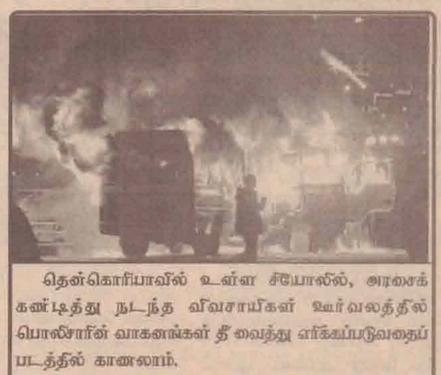
தென்கொரியாவில் உள்ள சீயோலில், அரசாங்க கண்டித்து நடந்த விவசாயிகள் உள் வலத்தல் மொலீசாரின் வாகனங்கள் தீ வைத்து எரிக்கப்படுவதைப் படத்தில் காணலாம்.

காபூலில் நடைபெற்ற இரட்டைத் தற்கொலைக் குண்டுத் தாக்குதல் நடந்து இரண்டு நாட்களுக்குப் பின்பு நேற்று இத்தாக்குதல் இடம்பெற்றுள்ளது குறிப்பிடத்தக்கது.