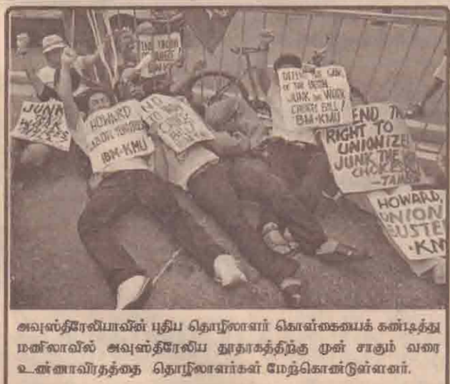
அவுஸ்திரேலியாவின் புதிய தொழிலாளர் கொள்கையைக் கண்டித்து மனிலாவில் அவுஸ்திரேலிய தூதரகத்திற்கு முன் சாகும் வரை உண்ணாவிரதத்தை தொழிலாளர்கள் மேற்கொண்டுள்ளனர்.

80 ஆயிரத்து 466 மாணவர்கள் இந்த ஆண்டு இந்தியாவிலிருந்து சென்றுள்ளனர். இது கடந்த ஆண்டை விட ஒரு சதவீதம் அதிகமாகும். சீனா இரண்டாவது இடத்திலும், தென்கொரியா மூன்றாவது இடத்திலும், ஜப்பான் நான்காவது இடத்திலும் உள்ளன.