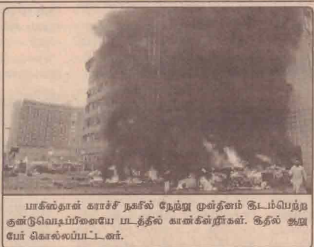
பாகிஸ்தான் காரச்ச் நகரில் நேற்று முன்தினம் இடம்பெற்ற குண்டு வெடிப்பினையே படத்தில் காண்கின்றீர்கள். தீயில் ஆறு பேர் கொல்லப்பட்டனர்.

அந்த வீட்டில் அவர்களுடன் மணமகனின் விதவைத் தாயாரும், வசித்து வருகிறார்.