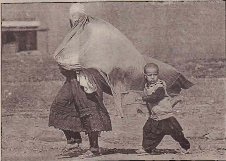
இஸ்லாமாபாத்திலுள்ள ஆப்கான் அகதிமுகாமியில் வசிக்கும் பர்தா அணிந்த ஆப்கான் பெண் ஒருவர் தனது குழந்தையை அழைத்துக்கொண்டு வீதியைக்கடந்து தனது முகாம் பகுதிக்குச் செல்கிறார்.