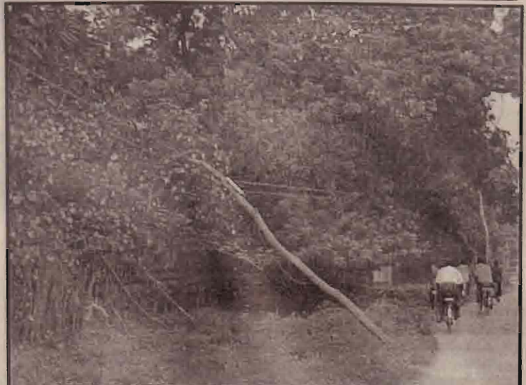
மாவீரர் தினத்தொட்டி மகாவித்தியாலயத்திற்கு அண்மையாக வீதிமேலும் மின் கம்பிமீது சரிந்து மின் கம்பிகள் மரமொன்றில் முட்டியபடி உள்ளதைப் படத்தில் காண்க. கடந்த ஒரு வாரத்திற்கும் மேலாகக் காணப்படும் இந்நிலை கிதுவரை சீரமைப்பதாய்வாய் மக்கள் அச்சத்துடனேயே பயணிக்கின்றனர்.