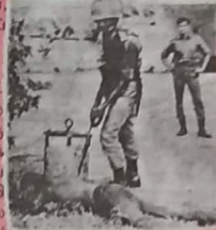
(London Telegraphy 26.07.83)

* சனாதிபதி ஜெயவர்தனாவின் வீட்டிற்கு 100 மீற்றர்கள் தொலைவில் கொடும்பு கண வைத்தியசாலைக்கு அருகாமையில் ஒரு தமிழ் துவிச்சக்கர வண்டி ஓட்டுனரை தாக்கிய குண்டர்கள் அவரை வண்டியிலிருந்து இழுத்தெடுத்து வெற்றோல் ஊற்றி எரித்தனர். அவர் கத்திக் கொண்டு ஓடும்போது திருப்பப் பிடித்து காட்டுக் கத்தியினால் வெட்டினர்.