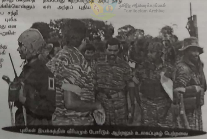
புலிகள் இயக்கத்தின் வீரியமும் போரிடும் ஆற்றலும் உடைக்கமுடி பெற்றவை

இன்றைய நிலையில், தேவையான ஆட்சேனையுடன் அந்த ஆளணியை போரில் எடுக்குத்த தேவையான பொருளியியத்தையும் புலிகள் இயக்கம் பெற்றுக் கொள்ள முயலின், யூத சேனை வரலாற்றுச் சாதனை படைத்ததபோல, சோவியத்துப் படை நாஜிகளுக்கு தோல்வியை பரிசீலித்ததபோல, புலம்பெட்டையும் களத்தில் பெருவெற்றியிடி சிங்களப்படைகளை எல்லாவற்றை விரட்டியடிக்கும். *