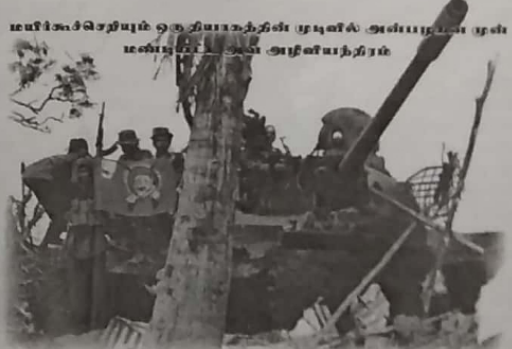
மீளிக்கொண்ட ஒரு தியானத்தின் முடிவில் அப்பகுதன் முன் மெலேயுடன் அணிவகுத்தான்

உண்மையில் அது ஒரு மயிர்க்கூச்சொழிபும் சம்பவம். அன்றைய கள நிலவரத்தில் புதிதாக உதவியணிகள் எடுக்கப்பட்டு, உள்நுகழ்ந்துவிட்ட ராங்குகளை கணப்ப தில் ஏற்படப் போதும் சிக்கலை தனது மொர் அனுபவம் மூலம் அவன் தெரிந்திருந்தான். எல்லவற்றிற்கும் மெலாக தனக்கிருந்த உடமையை அவன் உணர்ந்திருந் தான். தன்வில் தங்கிநின்ற ஒரு சண்டையை, ஒரு சமரின்