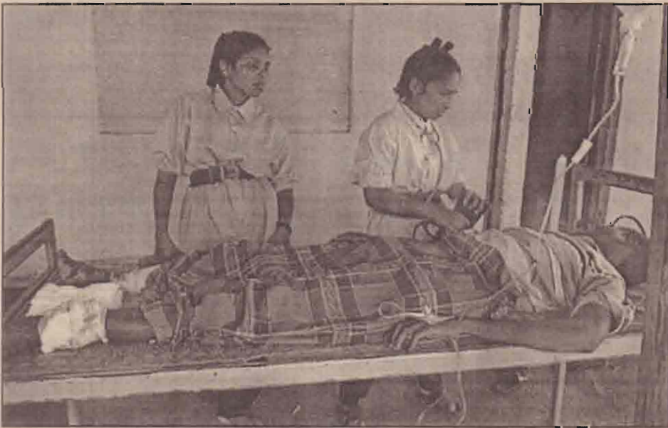
சிகிச்சை அளிக்கும் போராளிகள்