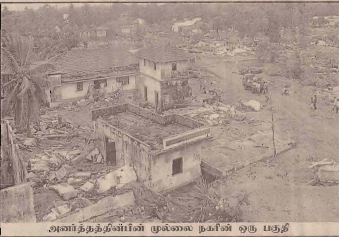
அனர்த்தத்தின்பின் முல்லை நகரின் ஒரு பகுதி