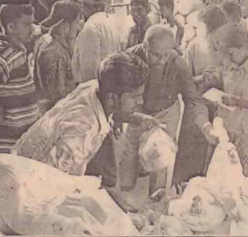
புதுக்கோட்டுச் சந்தியில் செயலணிக் குழு சந்திப்பு