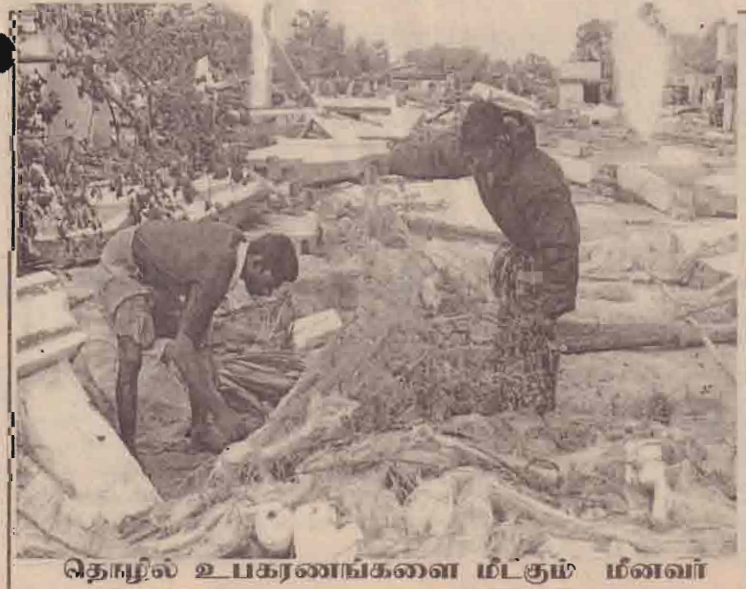
தொழில் உபகரணங்களை மீட்கும் மீனவர்

நேற்று தண்ணீர் வறிய வித்தியானந்தாக்கல்லூரியில் உறவுகளுடன் தொடர்புகளை ஏற்படுத்திக் கொள்வதற்காக வன்னியன் தொலைத்தொடர்பு நிலையம் ஒன்று இயங்குவதற்கு ஒழுங்குகள் மேற்கொள்ளப்பட்டு வருகின்றது. இதனை விரைவில் பூர்த்தி செய்து மக்களின் தொடர்புகளை உடனுக்குடன் அறிவிப்பதற்கு ஏற்பாடு செய்யப்பட்டுள்ளது குறிப்பாக நலன்புரி நிலையங்களில் வாழும் மக்கள் தமது இடங்களுக்கு திரும்பிச் செல்லும் வரை அவர்களுக்குரிய உணவு வகைகளை வழங்குவதில் தாம்தொடர்ந்தும் ஈடுபடுவதாக தமிழீழ புனர்வாழ்வுக் கழகம் தெரிவித்துள்ளது. (கு.ச)