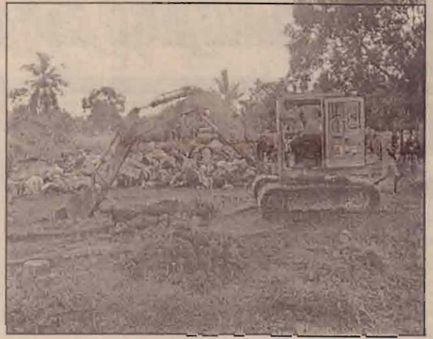
புதைகுழி தோண்டும் இயந்திரம்