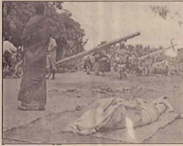
போர்த்தி விடப்பட்ட சடலம்