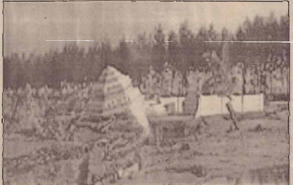
சாய்ந்து கிடக்கும் கோபுரம்