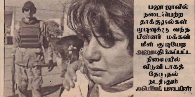
பலூ ஜாவில் நடைபெற்ற தாக்குதல்கள் முடிவுக்கு வந்த பின்னர் மக்கள் மீள் குடியேற அனுமதிக்கப்பட்ட நிலையில் வீடுவிடாகத் தேடி தலநடத்தும் அபிஷிப் மையின்

ஏற்பட்டு கடல் நீர்மட்டம் உயருகிறது. இது கடற்கரைப் பகுதியில் மிகுந்த அரிமானத்தை ஏற்படுத்துகிறது. 20 ஆம் நூற்றாண்டில் சராசரியாக ஆண்டுக்கு முக்கால் அடி கடல் மட்டம் உயர்ந்து வருவதாகக் கணக்கிடப்பட்டு இருக்கிறது. பருவநிலை மாறுபாடு குறித்து ஐ.நா. சபையின் நிபுணர் குழு அடுத்த நூற்றாண்டில் கடல் மட்டம் இன்னும் வேகமாக உயரும் என்று மதிப்பிட்டுள்ளனர். இதனால் மலேசிய போன்ற நாடுகள் சனாமித் தாக்குதலில் கடலில் மூழ்கி காணாமற்போகும் அபாயம் அதிகரித்துள்ளது. அங்கு கடல் மட்டத்திற்கு மேல் 6 அடி உயரத்தில்தான் தீவு இருக்கிறது. வங்க தேசத்தில் 17 இலட்சம் மக்கள் கடல் மட்டத்திற்கு மூன்று அடி உயரமான நிலப்பரப்பிற்கு வசிக்கின்றனர். அமெரிக்காவின் புளோரிடா மாகாணத்திலும் இதே நிலைதான்.