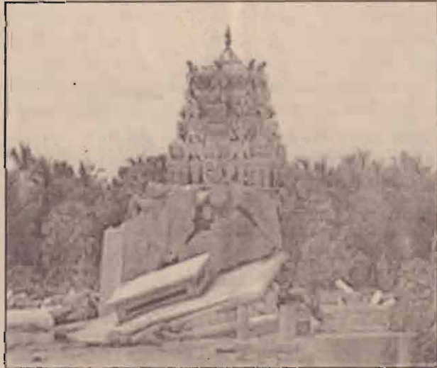
இடிந்துவிழுந்த கோவில் மண்டபம்