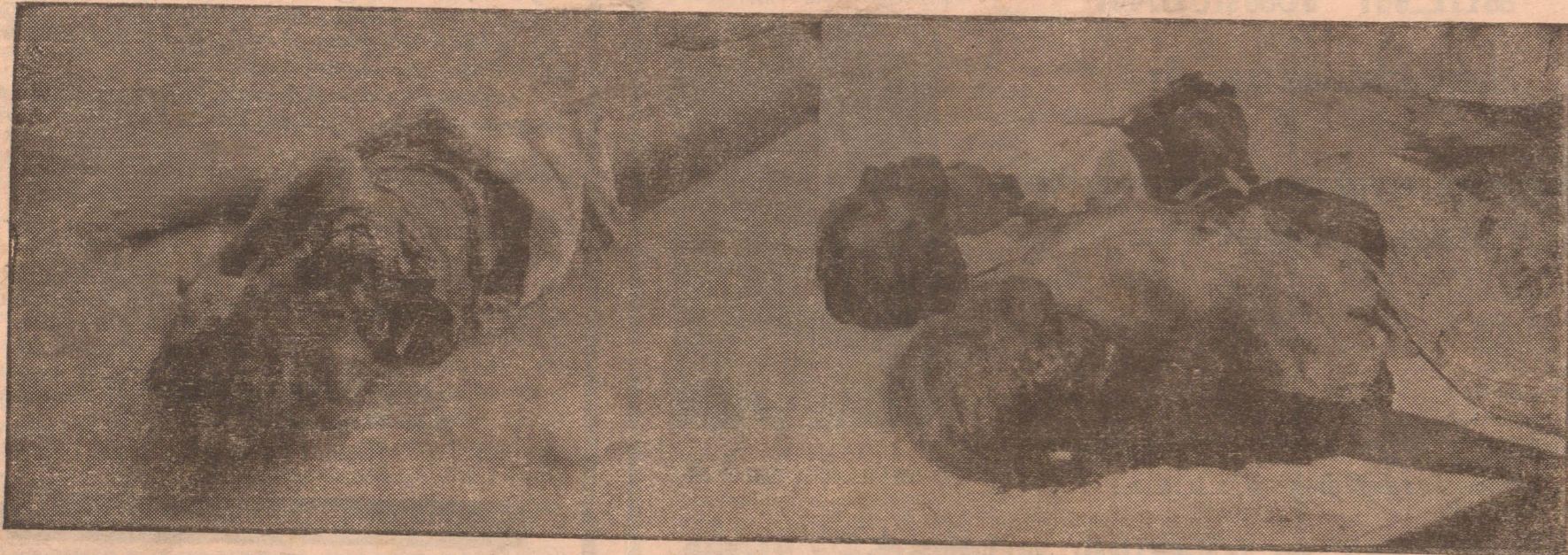
நேற்று சிறிலங்கா படையினரால் அச்சுவேலி பகுதியில் மேற்கொள்ளப்பட்ட தாக்குதல்களில் கொல்லப்பட்ட சிறுமி ஒருவரின் சடலத்தை முதலாவது படத்திலும் மேலும் இருவரின் சடலங்களை இரண்டாவது படத்திலும் காணலாம்.