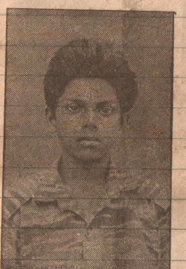
2ஆம் லெப் சலீம்