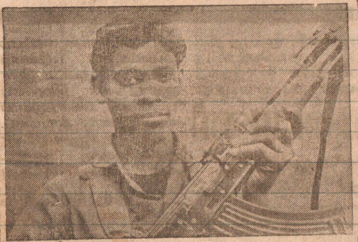
மாவீரன் ஹீரோ அவர்கள் (இராமகிருஷ்ணன் இதயராசா)

வீரப்பிறப்பு 10-10-1973 வீரச்சாவு 12-05-1991