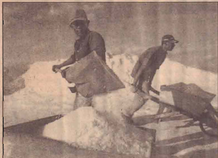
கொலம்பியாவில் 16ம் நாற்றண்டிலிருந்து நடைபெற்று வரும் உப்பு உற்பத்தி அண்மைய சந்தைப் போட்டியாலும் காண் அபகரிப்பினாலும் கைவிடப்பட்ட நிலையில் அச்சுறுத்தலுக்குள்ளாகியிருக்கும் வயு இந்திய குடிகள் உப்பை அள்ளுகின்றனர்.