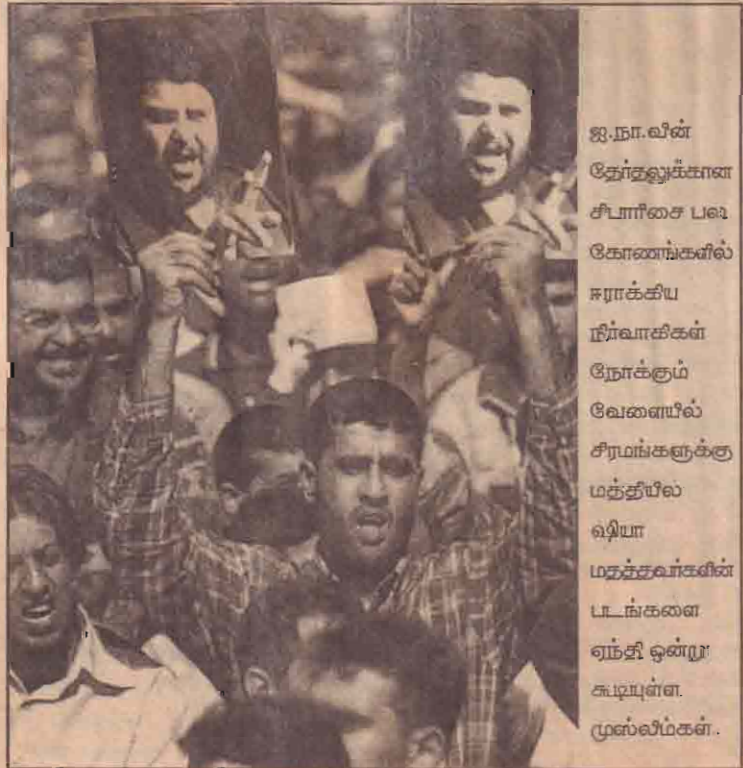
ஐ.நா.வின் தேர்தலுக்கான சிபாரிசை பல கோணங்களில் ஈராக்கிய நிர்வாகிகள் நோக்கும் வேளையில் சீரமங்களுக்கு மத்தியில் ஷியா மதத்தவர்களின் படங்களை ஏந்தி ஒன்று கூடியுள்ள முஸ்லிம்கள்.

ஊழல் மேசடிக்குற்றச் சாட்டுகளுக்கு இலக்காகியுள்ள சனாதிபதியை ஆட்சியிலிருந்து கவிழ்க்க முன்னாள் ஆழநுட்படை வீரர்கள் கிளர்ச்சி ஒன்றை ஆரம்பித்துள்ளமை தெரிந்ததே.