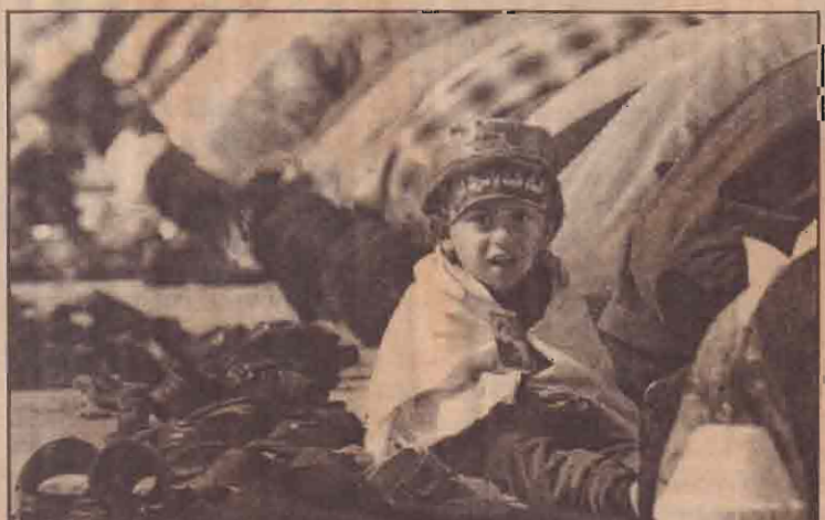
நேற்று முன்தினம் பாக்குத்துக்கு அண்மையில் நடைபெற்ற ஷியா முஸ்லிம்களின் வழிகாட்டு நிகழ்வின் போது "குர்ஆனை நேசீப்பவர்களுக்கு சாந்தி கிடைக்கும்" என்ற கலோகத்தையுடைய நாடாவை தலைவில் கட்டியிருக்கும் ஈராக்கிய சிறுவன்.