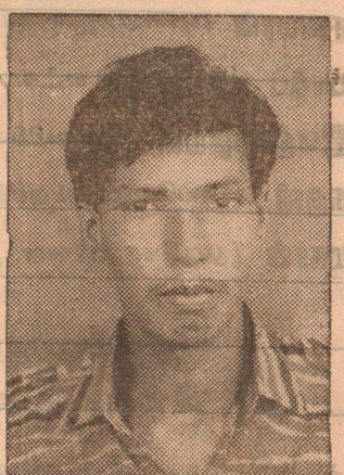
லெப். விங்கம் [விற்கொடியோன்]