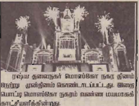
ரஷ்ய துணைநகர் மொஸ்கோ நகர ஜினம் சிறுந்து முன்னிணம் கொண்டாடப்பட்டது. அனைத்து மொஸ்கோ நகரம் வண்ண மயமாகக் காட்சியளிக்கின்றது.

பேரணியில் பங்கேற்றவர்களைக் கலைக்க பொலிசார் கண்ணீர்ப்பு கைக் குண்டுகளை விசி கூட்டத்தினரைக் கலைத்தனர். இதில் லேசாக காயமடைந்த கொய்ரலா மருத்துவ மனையில் சேர்க்கப்பட்டார்.