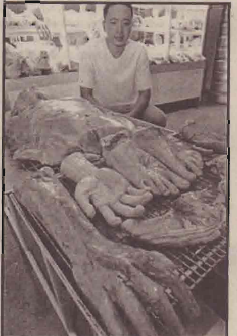
இது என்ன மனிதக் மாபீசக் கடை என நினைக்கத் தோன்றுகிறதா? இல்லை. தாய் ஸாந்தின் பாவனாக அருகே ரஞ்சாயில் மனித உடல் உறுப்புக்கள் போல ரொப்ப துயர் செய் யப்பட்டு வீழ்பனை செய்யப்படுகின்றது. மனி துவான மனிதனை அடித்துச் சாப்பிடும் காலம் வருகிறதோ? இல்லையோ ஆனால் அப்படி சாப்பிட வேண்டும் என்று எண்ணும் வந்தது. போசீக்க வேண்டிய வீட்டும் தான்.