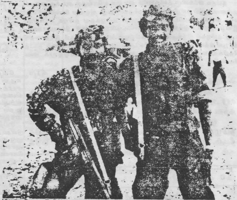
Liberation Tiger guerilla fighters sustained by the people