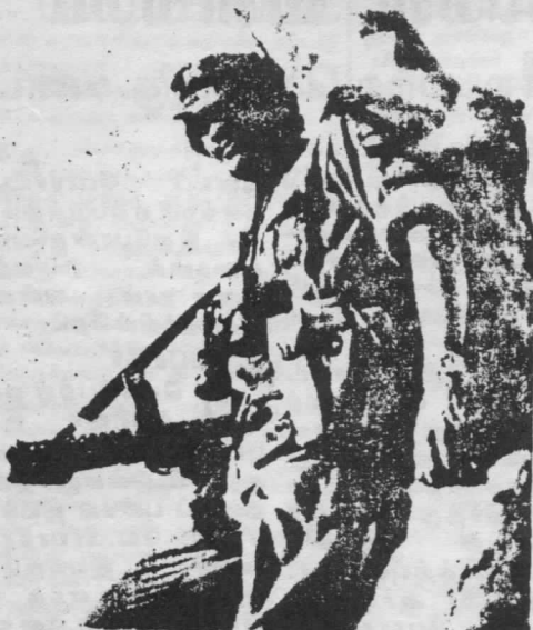
A young Tamil guerilla fighter in the struggle for a separate socialist state of Tamil Eelam

Saturday January 26, 1986. Telex: London 916427 Newdesk 01-720 6794