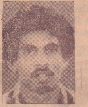
கரும்புலி கட்டுன் மில்லர்

பாழ். குடாநாட்டின் மிகவுரிசை தாக்குதலின் ஒரு கட்டமாக வடமராட்சி 'விபரேஷன் ஒப்பிரேஷன்' இலக்கை அரசு மேற்கொண்டது. கட்டடம் கை நிர்மூலமாக்கியும், மக்களை அழித்தொழித்தும் தனது இராணுவ நடவடிக்கையை அரசு மேற்கொண்டது. யூ.சு.அமைச்சர் பாணியிக்கு தேசிய பாதுகாப்பு அமைச்சர் வலிசை அத்துடன் முதல் நேரடியாகக் கைத்தில் நின்று நாயர். அவரே விமானத்தி விருந்து பிப்பாக்குகின்றவர்களை குடிமணக்கி மீது உருட்டி விட்டதாக ஓர் அபிப்பிராயம் நிலவுகின்றது. பெரும் அழிவுகளை இந்த இராணுவத்தினர் செய்ய முடிந்ததென்பது உண்மை. இத்தகைய தொடர்ந்து