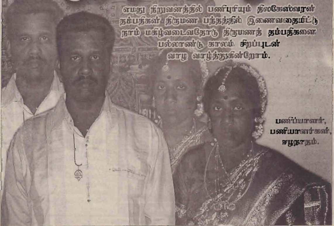
பணியாளர், பணியாளர்கள், சமுநாதம்.

எமது நிறுவனத்தில் பணியும் தலைகேள்வரன் தம்பதிகள் திருமண பந்தத்தில் இணைவதையிட்டி நாம் மகிழ்வடைவதோடு திருமணத் தம்பதிகளை பல்லாண்டு காலம் சிறப்பிடம் வாழ வாழ்த்துகின்றோம்.