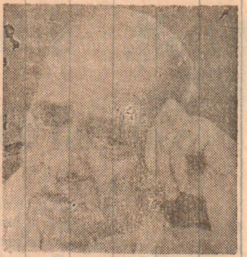
அமுலாக்கலுக்கான அதிகாரிகள் மிகுந்த விழிப்புடன் கண்காணிக்க வேண்டும் எனவும் கேட்டுக் கொண்டார்.

நாட்டின் ஒற்றுமையைக் குலைப்பதற்காக வெளியாரின் தூண்டுதலோடு விடுக்கப்படும் மிரட்டல்களையும் சட்ட