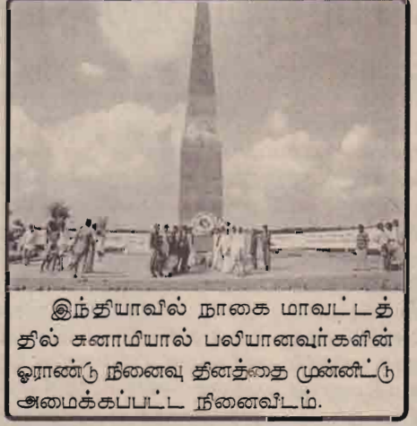
இந்தியாவில் நாகை மாவட்டத்தில் சனாமியால் பலியானவர்களின் ஓராண்டு நினைவு தினத்தை முன்னிட்டு அமைக்கப்பட்ட நினைவிடம்.

அமெரிக்காவுக்கு அருகே உள்ள மெக்சிக்கோ நாட்டிலுள்ள இராட்சத எரிமலை வெடித்துச் சிதறியுள்ளது. இந்த எரிமலையில் இருந்து நேற்று கற்களும், சாம்பலும், வெளித்தள்ளப்பட்டன. புகையும், எழுந்தது. மூன்று கிலோமீட்டர் உயரத்திற்கு புகையும், சாம்பலும் எழுந்தன. இதனால் அருகிலுள்ள நகரங்கள் பாதிக்கப்பட்டன.