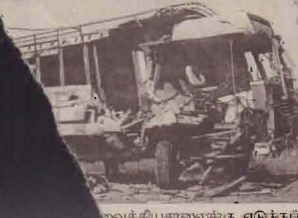
வைத்தியசாலைக்கு எடுத்துச் செல்லப்பட்டது (73)