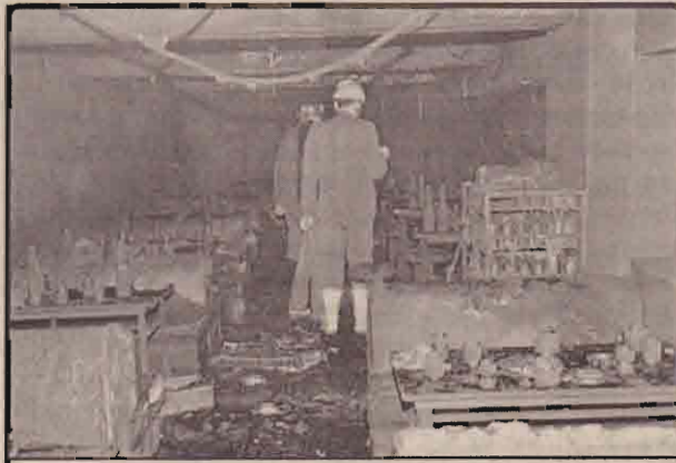
சீனாவில் கேளிக்கை வீடுதீயில் கீறல்மல் தினத்தன்று ஏற்பட்ட தீ விபத்தில் சேதமடைந்த பகுதியைப் படத்தில் காணலாம்.

அவ்வேளை திடீரென இரசாயன வாயுக்கசிவு ஏற்பட்டுள்ளது. இதனைச் சுவாசித்த சுமார் 80 பேர் சுவாசக்கோளாறு மற்றும் வாந்தி போன்ற உபாதைகளுக்கு ஆளாகினர். இது தொடர்பான விசாரணைக்கு உத்தரவிடப்பட்டுள்ளதாக அந்நகரின் பாதுகாப்புத் துறை செய்தித் தொடர்பாளர் தெரிவித்தார்.