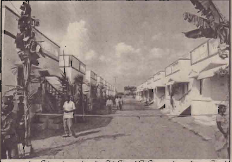
காரைக்காலில் உள்ள மண்புத்தூரில் தொண்டு நிறுவனங்களால் சனாபியால் பாதிக்கப்பட்டோருக்கு கட்டப்பட்ட குடியிருப்புகள்

கடந்த வருடம் ஆரம்பமான இப்பேச்சுக்கள் இரண்டு நாடுகளுக்கிடையிலான பதற்றத்தைத் தணித்த அதேவேளை முக்கிய முரண்பாடான சர்ச்சைக்குரிய காஷ்மீருக்குரிய அந்தஸ்து குறித்தும் தீர்வு காணத் தவறி விட்டது என்றும் செய்தியாளர்கள் தெரிவித்துள்ளனர்.