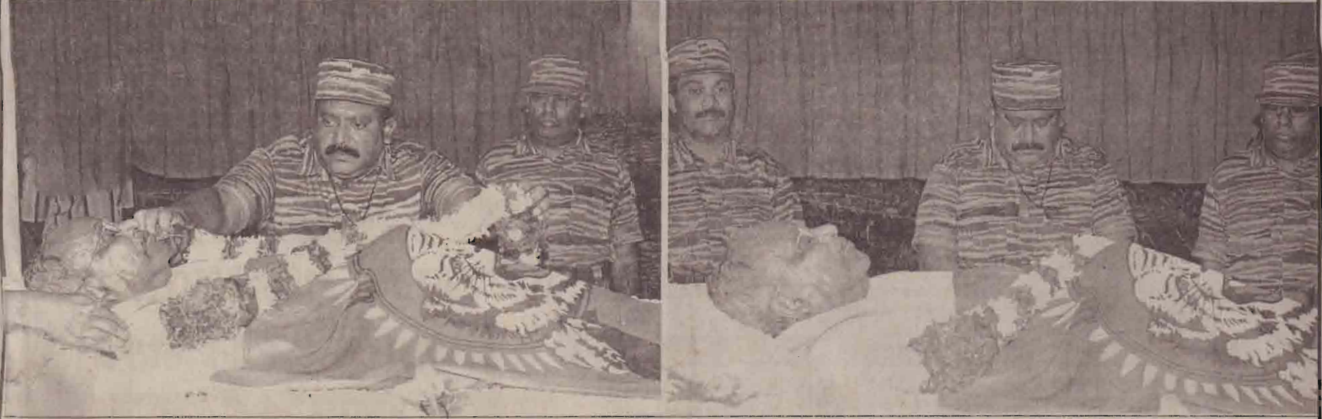
நேற்று மாலை கிளிநொச்சிக்கு எடுத்துவரப்பட்டு தாயவன் அரசறிவியற்கல்ஜூனியில் வைக்கப்பட்டிருந்த மாமனிதர் ஜோசப்பரராசசிங்கம் அவர்களின் புகழுடலுக்கு தமிழ்தேசியத்தலைவர் மேதகு வே. பிரபாகரன் அவர்கள் தனது இறுதி வணக்கத்தைச் செலுத்தினார்.