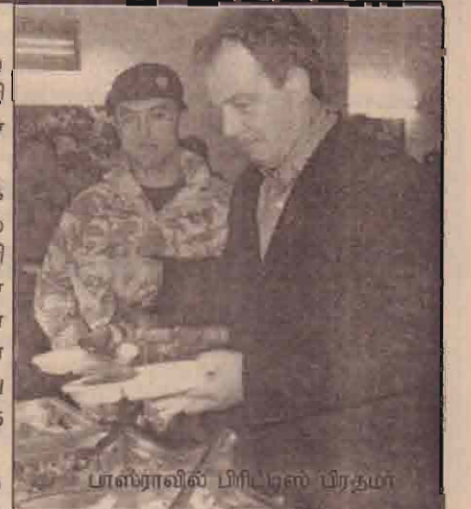
பாஸ்டானில் பிரிட்டிஷ் பிரதமர்

மிடையில் போர் நடைபெறுவதாகக் கூறினார். நான்தோறும் இங்குள்ள மக்கள் தமது உயிரைக் காப்பாற்றிக் கொள்ளப் போராடி வருவதாகவும் விரைவில் சனநாயக ரீதியில் தேர்தல் நடைபெற்றுப் புதிய அரசு உருவாகும் என்றும் ரொனிபிளேயர் மேலும் தெரிவித்தார்.