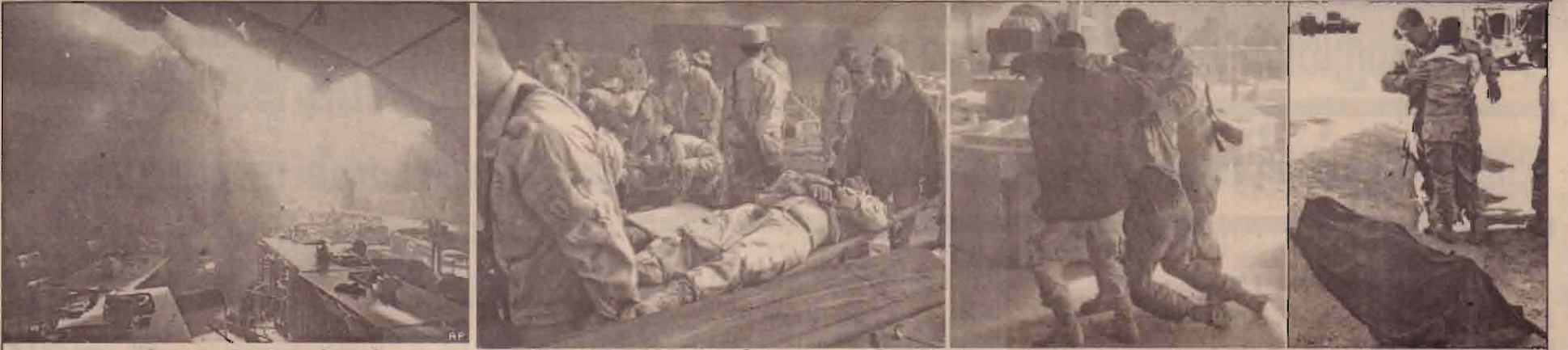
மொசூலில் தீவிரவாதிகளின் ரொக்கெட் மற்றும் பீரங்கித்தாக்குதலில் சேதமான அமெரிக்கத்தளத்தின் ஒரு பகுதியையும் தாக்குதலில் காயமடைந்த படையினர் அவசரஅவசரமாக அகற்றப்படுவதையும் படையினர் ஒருவருடைய சடலத்தையும் படங்களில் காண்க.