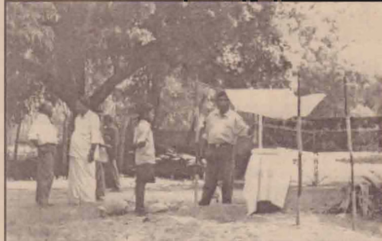
பூநகர் நாச்சிக்குடாப் பகுதியில் மழைநீரை வளி கட்டிச் சேகரித்தல் குடிநீருக்காகப் பயன்படுத்தும் பொருட்டு கையாளப்படும் விதிமுறையொன்றைப் படத்தில் காண்கிறீர்கள்.

இந்நிகழ்வின் ஆரம்ப நிகழ்வாக பொதுக்கூட்டினை கலைஞர் பிலிற்யோன்கபாஸ் ஏற்றினார். அதனைத் தொடர்ந்து தமிழ் தேசியக்கொடியினை அரசியல் துறை சமாதானச் செயலகப் போராளி தர்சன் ஏற்றிவைத்ததைத் தொடர்ந்து மாணவர்களின் கான ஈக்கூட்டினை நவம் அறிவுக் கூடப்பணிப்பாளர், கலைக்கோன் அவர்கள் ஏற்றிவைத்தார். அதன் பின்னர் மேடை நிகழ்வுகள் நடைபெற்றன.