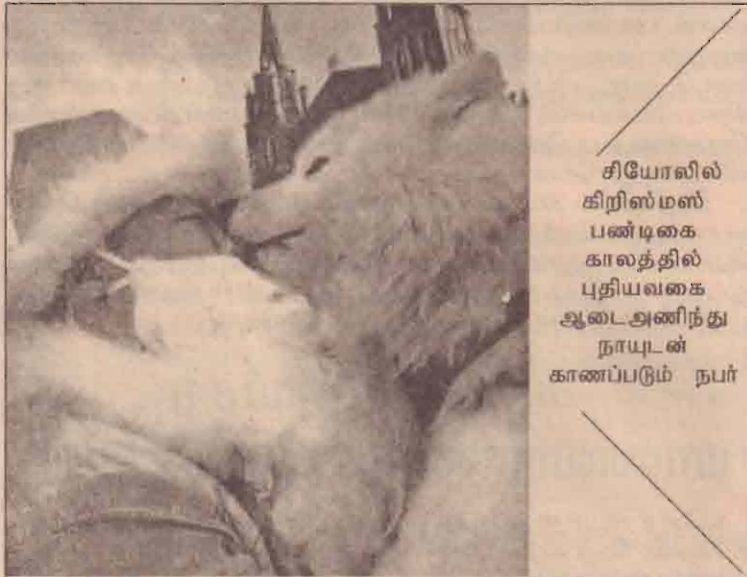
சியோலில் கிறிஸ்மஸ் பண்டிகை காலத்தில் புதியவகை ஆடைஅணிந்து நாயுடன் காணப்படும் நபர்

ஈராக்கில் சதாம்ஹுசைன் ஆட்சியிலிருந்து அகற்றப்பட்டபோது ரம்ஸ்பெல்டுக்கு இருந்த 71 சதவீத சென்வாக்கு இப்போது 42 சதவீதமாகக் குறைந்து விட்டது. குடியரசுக் கட்சியைச் சேர்ந்தவர்கள் உட்பட எம்.பி.க்கள் பலர் ரம்ஸ்பெல்டின் செயற்பாட்டைக் குறைசுறி விமர்சித்துள்ள போதிலும் சானதிபதிஜோர்ஜ் டபிள்யூ புஷ் அவர் நன்றாகச் செயற்படுகிறார் அவர்பாதுகாப்பு அமைச்சராக நீடிக்கவேண்டும் என்று திங்கட் கிழமை கருத்துசுறியுள்ளார். இதே வேளை சனாதிபதி புஷ்சின் சென்வாக்கும் 55 சதவீதத்தில் இருந்து 49 சதவீதமாகக் குறைந்துள்ளது.