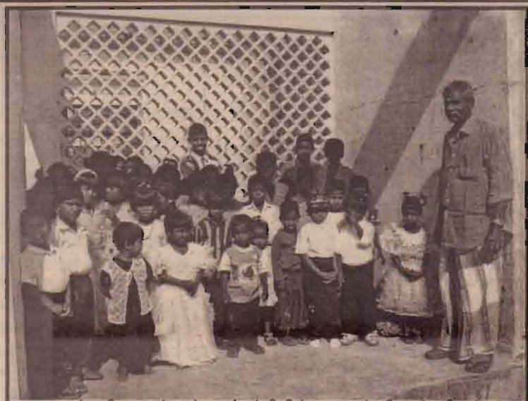
நாவற்குறி அரும்புகள் முன்பள்ளியின் அவலம் நிறைந்த தோற்றம் - முன்பள்ளி அமைந்துள்ள கூரை இல்லைத வீட்டில் முன்பள்ளி மாணவர்களுடன் 300 வீட்டுத் திட்ட தலைவர்.

இது சம்பந்தமான மேலதிக தகவல்களைப் பெற விரும்பும் மாணவர்கள் பூங்கனிச்சோலைக்கு அருகில் உள்ள யாழ்.மாவட்ட மாணவர் அமைப்பின் தலைமை அலுவலகத்தில் உடன் தொடர்பு கொள்ளும்படி கேட்டுக் கொள்ளப்பட்டிருக்கிறார்கள். (28)