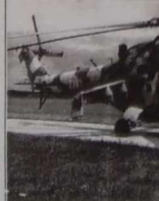
MI-24 ரக உலங்குவானூர்தி

அழிக்கப்பட்ட மூன்று A 8 பயிற்சி விமானங்கள் அண்மையில் சிறிலங்கா வான்படையால் சீரையில் இருந்து கொள்வனவு செய்யப்பட்டனவாகும்.