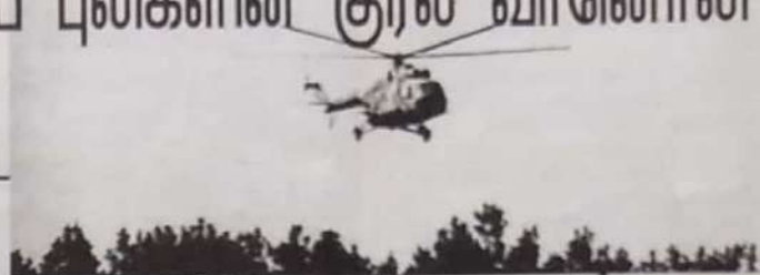
MI-17 ரக உலங்குவானூர்தி

சிறிலங்கா அரசினரும் முப்படைகளினதும் இடையேயான சிறிலங்கா வான்ப்படையின் பிரதான மையத் தளத்தினுள் இன்று அதிகாலை முதல் முற்பகல் வரை விடுதலைப் புலிகள் மேற்கொண்ட துணிசூர ஊடுருவல் தாக்குதலில் சிறிலங்கா வான்ப்படையின் 8 வான்ணர்திகளும் 3 போக்குவரத்து வான் ஊர்திகளும் முற்றாக தகர்க்கப்பட்டன என 3 போக்குவரத்து வான்ணர்திகள் கருமையான சேதம் அடைந்துள்ளன. செய்தி ஊடகங்கள் தரும் தரவுகளின்படி விடுதலைப் புலிகளின் அணி ஒன்று ஊடுருவல் நடவடிக்கை ஒன்றை மேற்கொண்டு உச்ச பாதுகாப்புக் கொண்ட கட்டுநாயக்க விமானப்படை தளத்தில் யுணமுத்து அங்கு இன்று அதிகாலை 3.25 மணி அளவில் தாக்குதலை தீவிரமாக ஆரம்பித்தனர். விமானப்படையின் அறிவுப் தாக்குதல் வலுவாக வான்ணர்திகளின் தரிப்பிடத்தின் மீது முதலில் தாக்குதலை விடுதலைப் புலிகள் நடத்தினர். இன்று காலை 7.30 க்குள் தரிப்பிடத்தில் நின்ற 8 வான்ணர்திகள் தாக்கப்பட்டு எரிபூட்டப்பட்டன. இதில் 8 வான்ணர்திகளும் தகர்ந்துபோயின. அத்துடன் ஏரிப்பொருள் தாங்கியும் எரிபூட்டப்பட்டன. மிக 279 க் மிகையொளி வேகத் தாக்குதல் விமானம் ஒன்று, கீ.பி. மிகையொளி வேகத் தாக்குதல் விமானங்கள் இரண்டு, MI-24 ரக தாக்குதல் வான்ணர்தி ஒன்று, MI-17 ரக படைக்காணி வான்ணர்தி ஒன்று, A 8 பயிற்சி விமானங்கள் மூன்று என்பன அழிக்கப் பட்டனவென்றும்.