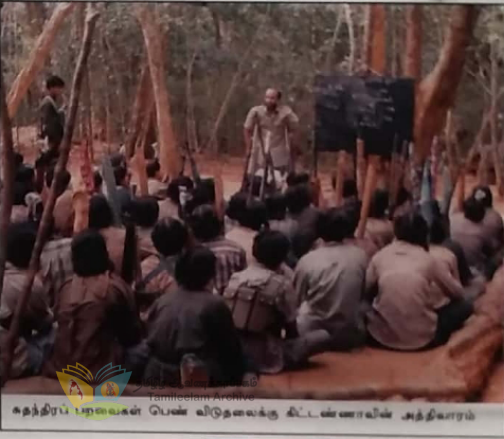
கதத்திரப் பழையகல் பெண் விடுதலைக்கு கிட்டன்னாவின் அத்தியாரம்