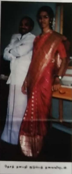
தேச தளபதி குழந்தை தலைவரின்

தமது வாழ்வை மட்டும் நினைவாமல், தமிழீழத்தை நினைத்தவர்கள், தங்களின் உயிரை நினைக்காமல் விடுதலைவை நினைத்தவர்கள், சாவு வரலாம் என்று தெரிந்தும் பயணம் செய்தவர்கள், செல்பவர்கள்; பயணம் சென்றவர்கள் பலர் வரவில்லை. ஒவ்வொரு முறையும் அவர்கள் நம் பயணத்தைத் தொடரும்போதும், நாம் எப்போதும் கரைவிலிருந்து கைவிடி வாழ்த்தி அனுப்புவோம். அது மட்டும்தான் எங்களால் முடியும் பரந்த கடலிலே அவர்கள் கரைந்தபோது எம்மால் அதை உணர முடிந்ததே தவிர உதவ முடியவில்லை. அவர்கள் எரிவதைக் கண்டோம்; எம் கண்களாலேயே பார்த்தோம், பார்த்துக்கொண்டே இருத்தோம், நாம் பார்த்துக் கொண்டிருக்க அவர்கள் எரிந்து கொண்டே இருந்தார்கள்.