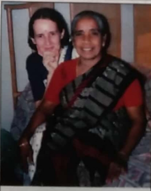
"பூமி கிட்டி குகை" எனத் தன் கவிதைக் கட்டிக்கொட்டி மகளின் கிரத்தை விளக்கினால் எங்கத்து கிரத்தாய் உதாரணையால் கிட்டி மயம்

தமது வாழ்வை மட்டும் நினைவாமல், தமிழீழத்தை நினைத்தவர்கள், தங்களின் உயிரை நினைக்காமல் விடுதலைவை நினைத்தவர்கள், சாவு வரலாம் என்று தெரிந்தும் பயணம் செய்தவர்கள், செல்பவர்கள்; பயணம் சென்றவர்கள் பலர் வரவில்லை. ஒவ்வொரு முறையும் அவர்கள் நம் பயணத்தைத் தொடரும்போதும், நாம் எப்போதும் கரைவிலிருந்து கைவிடி வாழ்த்தி அனுப்புவோம். அது மட்டும்தான் எங்களால் முடியும் பரந்த கடலிலே அவர்கள் கரைந்தபோது எம்மால் அதை உணர முடிந்ததே தவிர உதவ முடியவில்லை. அவர்கள் எரிவதைக் கண்டோம்; எம் கண்களாலேயே பார்த்தோம், பார்த்துக்கொண்டே இருத்தோம், நாம் பார்த்துக் கொண்டிருக்க அவர்கள் எரிந்து கொண்டே இருந்தார்கள்.