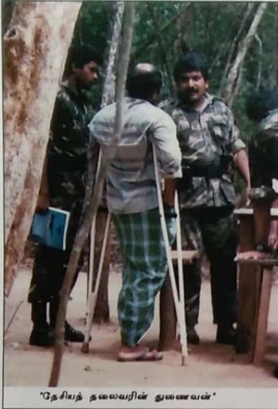
"தேயித் தலைவரின் குணவயல்"