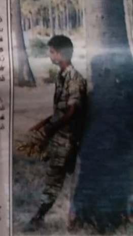
• வெப். கேணல் குட்டி சிறி

அதன்பின் கப்பல் தமிழாட்சை நோக்கிச் செல்லுமாறு இந்தியக் கடற்படைவீரர்கள் கற்றுக்கொடுத்த தொடர்ச்சி அம் பக்கம்