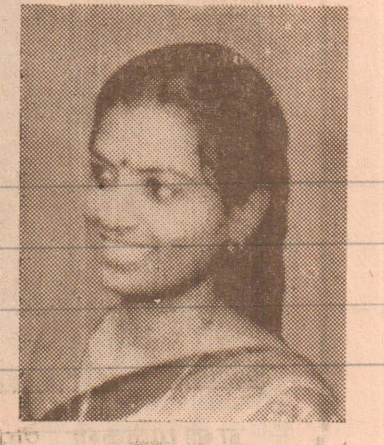
பிரதாயப் பார்வைக்குமாறு பட்ட வக்கிரம், விரசம் என்றெல்லாம் கூறுகிறார்கள். உடல் அழகின் கவர்ச்சி மேலோங்கி நிற்பதாக

த்திட்டிக் கொண்டிருக்கிறேன். இன்றைய சூழலில் குடும்ப வாழ்க்கை, காதல் அன்பு, பெண்களின் அவலம் என்பவற்றைச் சுற்றி ஓவியங்கள் வளர்ந்து கொண்டிருக்கின்றன. அவை விரைவில் முழுமை பெறும் என்பது எனது நம்பிக்கை. நீங்கள் வரைகின்ற ஓவியங்கள் முழுமையானவை என்ற திருப்தியைக்கு உள்ளதா? ★ கீற பொருள் இதய பூர்வமான ஈடுபாடாக வெளிப்படும் போது அது முழுமை பெறுகின்றது. தான் கண்டதையும், கேட்டதையும் சுய அனுபவத்தையும் தான் ஓவியமாகத் தீட்டுகிறேன். உதாரணமாக, அண்மைக் கால நிலைவுகள் தான் மன உந்தலாக 1991 இல் சர்வதேச மகளிர் தினத்துக்கான ஓவியப் போட்டியில் முதல் பரிசு