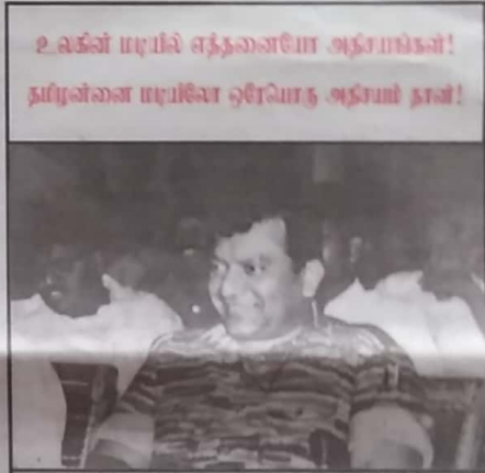
உங்கள் ஈழம் எத்தனைபோ அநாயகம்! தமிழ்நாடு ஈழமே ஒருவாறு அநாயகம் தான்!

உயிருடனும் கொண்டும் சிறிலங்கா இராணுவத்தால் முறையாகப்பட்ட மரணப் புதைபடுகளை விவரம் அதில் பங்கு பற்றிய சிங்கள இராணுவத்தினரால் சிறிலங்கா இராணுவச் செயல்திறனால் ஏற்பட்ட வெற்றிடத்திற்கு யாழ்க்குடா நாட்டு இராணுவத் தளபதியான மேஜர் ஜெனரல் அனோகா ஜெயவர்தனாவை