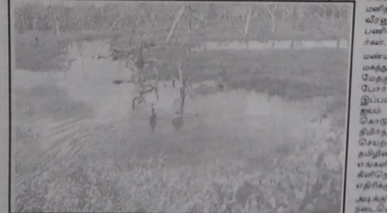
உயர்ந்த மண். பலவகைத் தானியங்களும் விளைந்து பவிராகி பயறும் சாமைமுயர் நோய்க்கு மருத்தாகி பரிப்பிணி மருத்துவனாய் எல்லோரையும் வாழ்விக்கும் வர லாற்றுப் பெருமை கொண்ட நல்ல மண். இரணமயம் நிறைந்திருக்க அதனால் நிறைவு கொள்ள எங்கள் சொந்தமண். நன்செய் நிலங்களும் தற்களம் ஊரணமை ஈழத்தின் எக்கு (பலச்செருக்கு 773) என்பது ஒரு குளராகும். பகைவர்களைக் கண்டோடாது தூடசன்மயம் கொண்டு குளிரும் ஒரு வீரன், அப்பகைவருக்கு போர்க்களச் சூழலில் ஏதாவது ஒன்று செய்து

முக்களிகளும் தங்கள் முகம் காட்ட, வந்தாரை வரவேற்று வாழ்வளிக்கும் மண். மாடு போய்த்து வளம் குன்றிப் போனாலும் தங்கள் நோய்வலியால் மீண்டும் தொடங்கும் மிருகங்கோ பாரை பின்பு பரிர்வினைவளிக்கும் வில சாவினை வாழ்வுக்கு ஊட்டமளிக்கும்