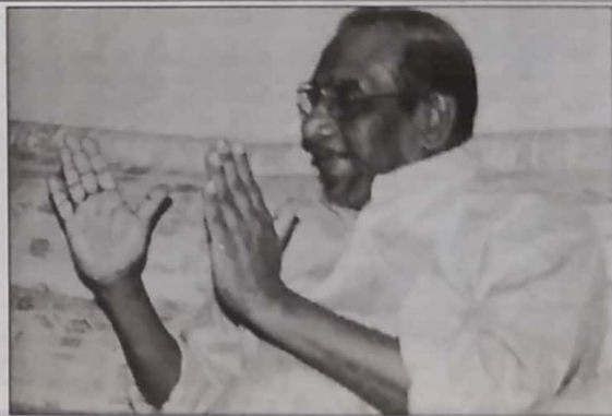
விடுதலைப் புலிகளின் அரசியல் ஆலோசகர் அன்ரன் பாலசிங்கம்

“தமிழீழ இனப்பிரச்சினைக்குத் தீர்வு காணும் யோசனைகள் பற்றி ஒருவருட கூலத்திற்கு பேச்சுக்களை நடைபெறக்கூடாதென 'புதிதுமணி'வு உடன்பாட்டின்' 20வது விதி தெரிவிக்க தீர்வுகளைக் குறிப்பிடுகிறது. இப்படியான தடைவிதியைக் கொண்டுள்ள உடன்பாட்டைச் செய்வதிட்டு சந்திரிகா அரசு எம்மையே பேசக்கூடு அழைக்கிறது. எமது மக்களின் பிரச்சினைக்குத் தீர்வுகாணும் யோசனைகள் வழிமுறைகள் பற்றி பேசமுடியாத ஒரு வரையறைக்குள் நின்றபடி, நாம் எதைப்பற்றிப் பேசுவது? அப்படியான பேச்சுக்களில் என்ன அர்த்தம்தான் இருக்கிறது. உண்மை என்னவென்றால், மக்கள் கூட்டணியும் ஜே.வி.பியும் செய்துள்ள உடன்பாட்டானது, சமாதானப் பேச்சுக்களுக்கு சர்வமணி அடித்தளமாக இருந்த உண்மையை முடிமறைக்கவே சந்திரிகாவும் கதிர்காமமும் சமாதானம் பற்றி அறிக்கைகளை வெளியிட்டுவருகின்றன. மஹால மலிந்த பாலசிங்கமே சந்திரிகா அரசிற்கும், சமாதானத்திற்கும் சர்வதேச மத்தியத்தவத்திற்கும் விமோதமான ஒரு தீவிர இடதுசாரி இயக்கத்திற்கும் மத்தியில் ஏற்பட்டிருக்கும் இணக்கப்பாடு குறித்து சர்வதேச அரசுகள் ஏமாற்றமடைந்துள்ளன. இந்த சர்வதேச அரசுகளைத் திருட்டுத்தொழிலாளர்களே நோக்கியே சிபிலிஸ்ட அரக திட்டமிட்ட பொய்யான சமாதானப் பேச்சுக்களுக்கு உட்பட்டிருக்கிறது.”