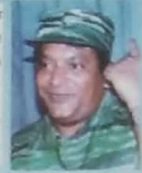
தமிழீழத் தேசியத் தலைவர் மெதகு வெ.ரொடாகரன் குணிகள்

ஆக்கிரமிப்பாளர்களின் கவடுகளை இந்த மண் ஒருபொழுதும் சுமந்து கொள்ளாது என்பதை எதிரிக்கு நாம் நன்றாக உணர்த்திவருகின்றோம்.