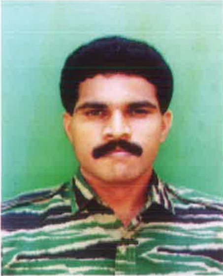
லெப். கேணல் ராஜன் சிறப்புத் தளபதி

1987 இன் தொடக்கப் பகுதியில் ஓர் இருண்டபொழுது. யாழ் பொலிஸ் விடுதியும் தொலைத்தொடர்புக் கட்டடமும் கோட்டைக்குத் துணையாய் நிமிர்ந்துநின்றன.