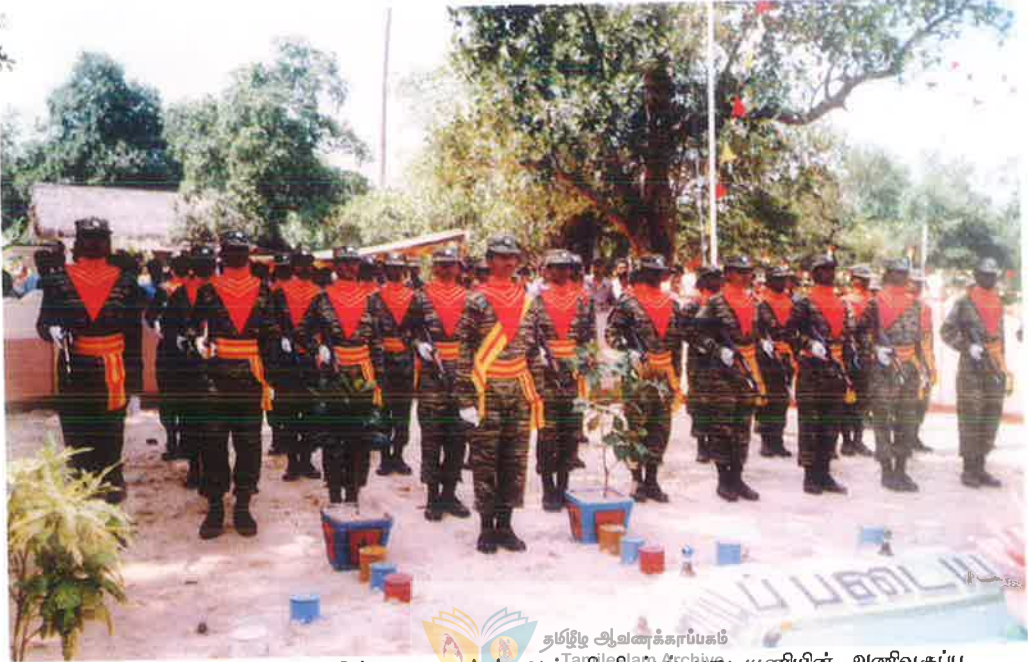
நினைவாலயத் திறப்புவிழாவின்போது சாள்ஸ் அன்ரனி சிறப்புப் படையணியின் அணிவகுப்பு