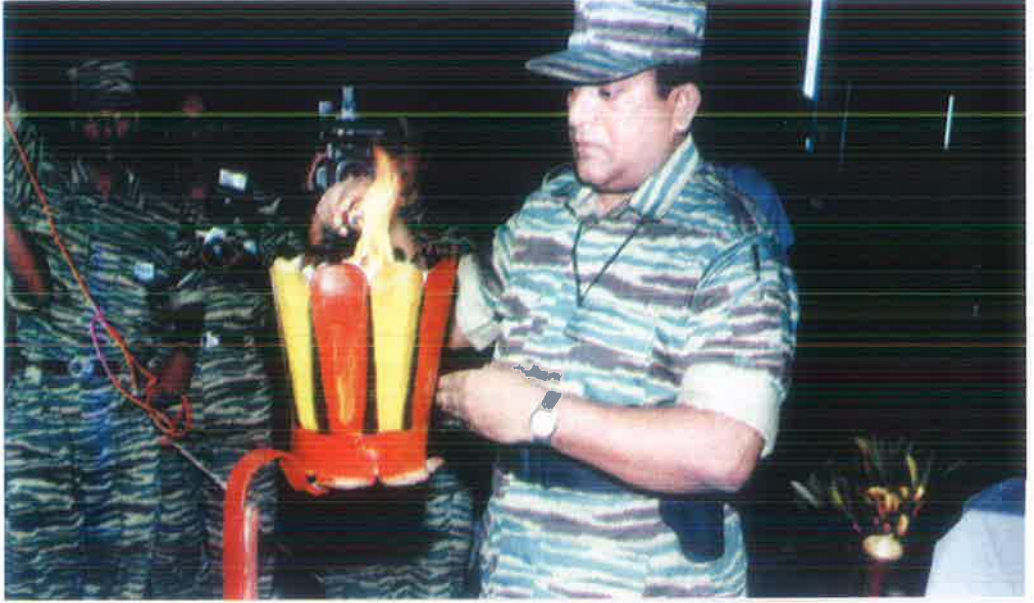
லெட். சீலனின் 18 ஆம் ஆண்டு நிறைவு நாளில் தலைவரவர்கள் பொது ஈகச் சுடரேற்றல்