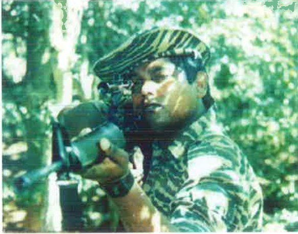
முதலாவது துணைத் தளபதி லெப். கேணல் ஜஸ்டீஸ்

இம்முறை நெருக்கமான சண்டை. 15-20 மீற்றர்கள் என நெருக்கமாக எதிரியைச் சந்தித்துக் கொண்டிருந்தோம். ஆணையிறவில் ஒரு மாதம் ஓயாது போரிட்ட சாளர் அன்றை சிறப்புப் படையணி மின்னல் களத்திலும் தனது பங்கை எடுத்துக்கொண்டது. காட்டுப் போர்முறை அனுபவமும்