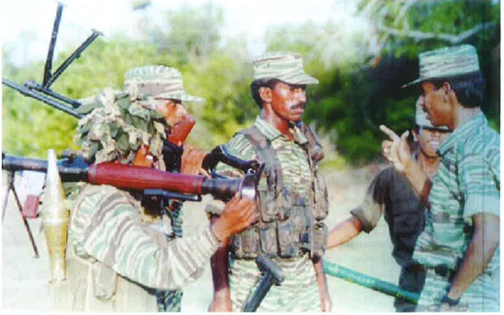
களத்தில் அணிக்குக் கட்டளையிடும் சூணைக்குறையுதி வீரமணி

இன்றைய நவீன சண்டைமுறையில் தேர்ச்சிபெற்ற அந்த ஆற்றல்மிகு தள பதியை 23.10.2000 ஆம் நாளில் நாம் இழந்தோம்.