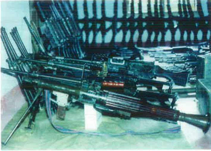
கட்டைக்காடு ஆயுதக்கிடங்கில் இருந்து கைப்பற்றப்பட்டதில் ஒரு தொகுதி ஆயுதங்கள்

இதேபோல 11.05.1992 அன்று கிளிநொச்சி மாவட்டப் படையணியுடன் எமது சிறப்புப் படையணியும் இணைந்து, ஆனையிறவின் கிழக்கு அரணாக அமைந்த, தட்டுவன்கொட்டித் தொடர்காவலரணில் இருபத்தியிரண்டு அரண்கள்மீது ஒரு திடீர்த்தாக்குதலை நடாத்தியது. 15 படையினரைக் கொன்று, ஆயுதங்களையும் மீட்டுவந்த இவ்வெற்றிகரத் தாக்குதலில் வேவுபார்த்ததிலிருந்து, திட்டமிட்டுத் தாக்குதலை