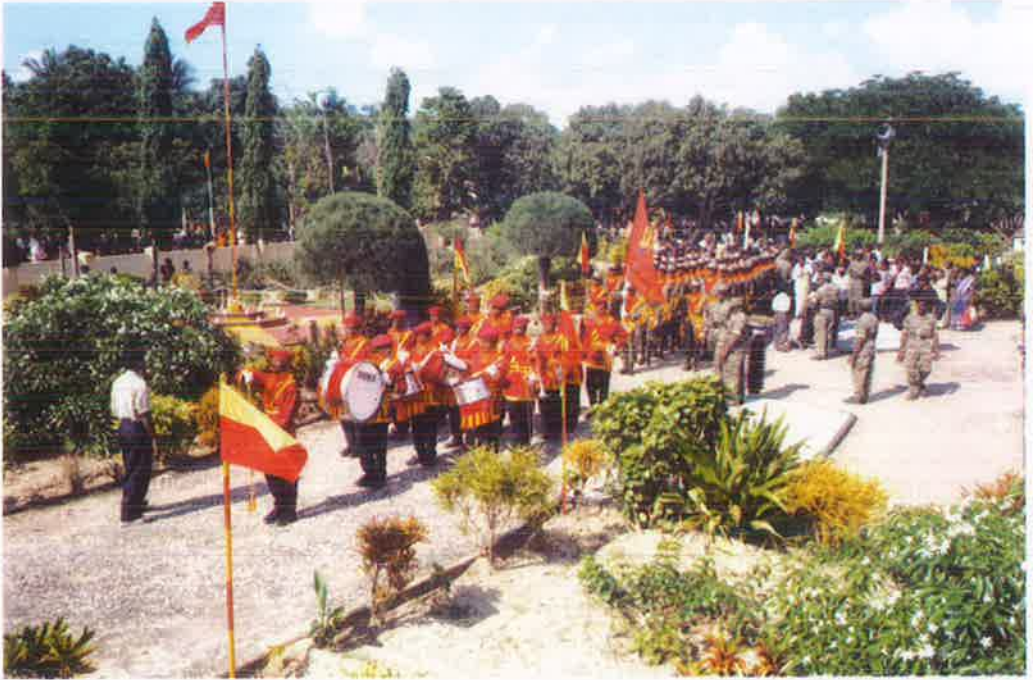
மாவீர் துயிலும் இல்லத்தில் சாள்ஸ் அன்ரனி படையணியினரின் அணிவகுப்பு