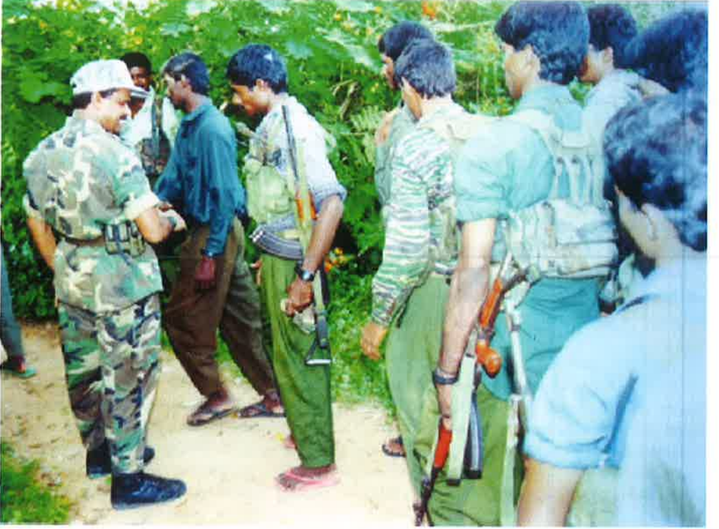
நடவடிக்கைக்கு எமது படையணி புறப்படுமுன் வாழ்த்தியஜும்பும் மூத்த தளபதி பால்ராஜ்

எமது படையணி கைப்பற்றவேண்டிய முன்னணி நிலைகளைப் பொறுத்தவரை அவை விசேட பாதுகாப்பு ஏற்பாடுகளைக் கொண்டவையாகவே இருந்தன. தளத்தின் பிரதான பகுதி மிகவும் குறுகிய தூரத்தில் இருந்தது (1998 பெப்ரவரிச் சண்டையில் இத்தளத்தின் முற்பகுதியில் 2½ கி.மீ. கைப்பற்றப்பட்டாயிற்று). தளத்தின் பிரதான பகுதியைக் கண்டி நெடுஞ்சாலை ஊடறுத்துச் சென்றமையே