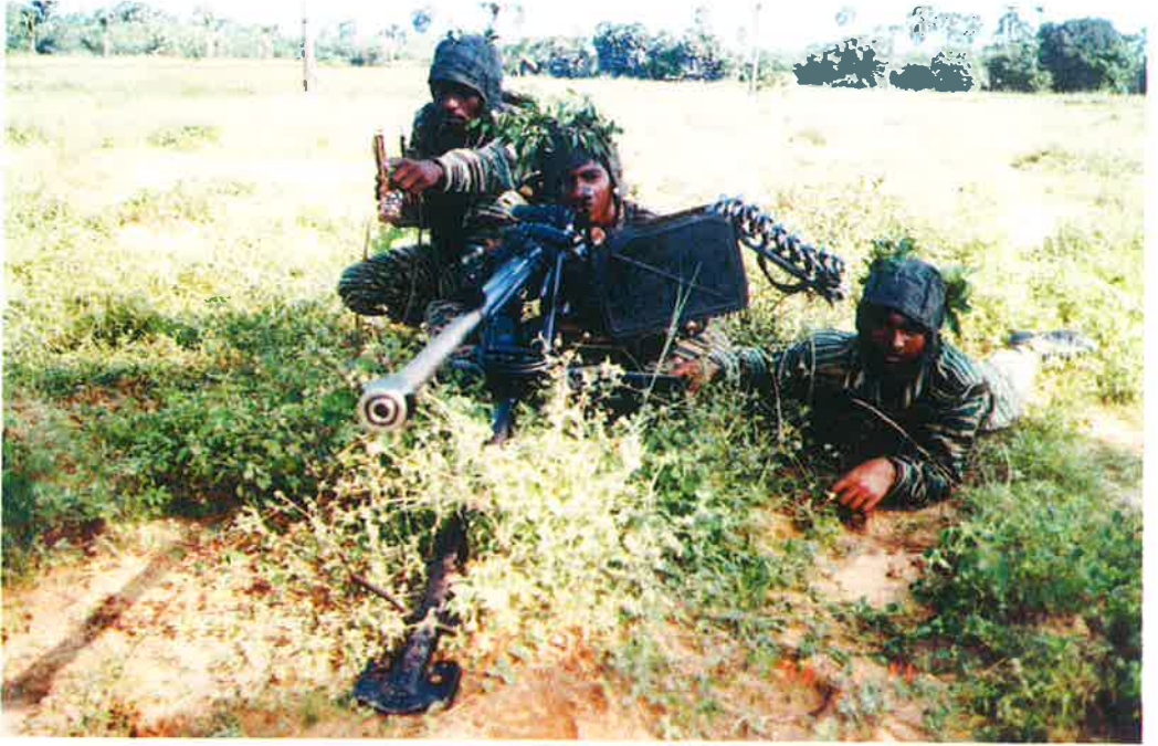
அக்கினிக்கேலாவுக்கு எதிராக குமுறுகின்ற எரிமலைகள்