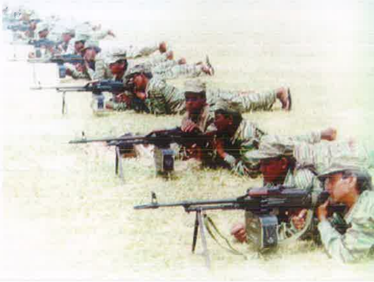
புதிய கனரக ஆயுதப் பிரிவு ஒன்றின் சூட்டுப் பயிற்சியில் ஈடுபடும் எமது படையணிப் போராளிகள்.

“விடுதலைப் புலிகள் தமது முன்னணிப் படையணியைப் பிரிவுகளைச் சண்டையில் ஈடுபடுத்தாதது தமக்கு ஐயத்தைத் தருவதாக இராணுவத் தரப்பினர் குழப்பம்”