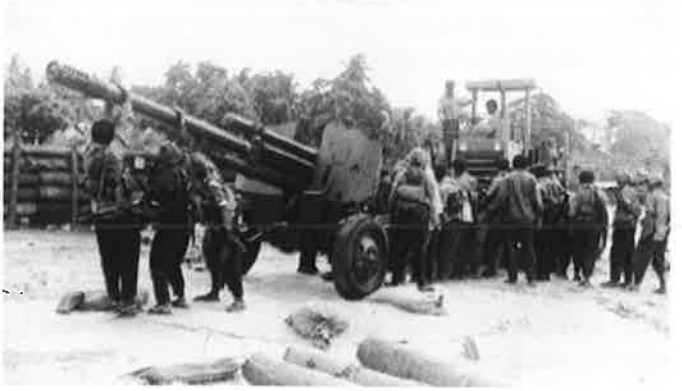
புலிகள் கைப்பற்றிய முதல் ஆட்லறி

படையினரில் ஏறக்குறைய 1200 பேரை ஒரே தடவையில் கொன்றழித்த 'ஓயாத அலைகள் - 01' தாக் கியழிப்புச் சமர் எதிர் பார்க்கப்பட்டது போலவே எமக்குச் சாதகமான இராணுவ, அரசியல் மாற்றங்களை ஏற்படுத்தியது. இவ்வரலாற்றுச் சமரிற் பங்கெடுத்துப் பெருமைபெறும் சாள்ஸ் அன்ரனி சிறப்புப் படையணி தமிழீழப் போர் வரலாற்றிற் பொன்னெழுத்துக்களால் பொறிக்கப்படவேண்டிய இன்னொரு சாதனையையும் நிலைநாட்டியது. தலைவரால் உருவாக்கப்பட்ட