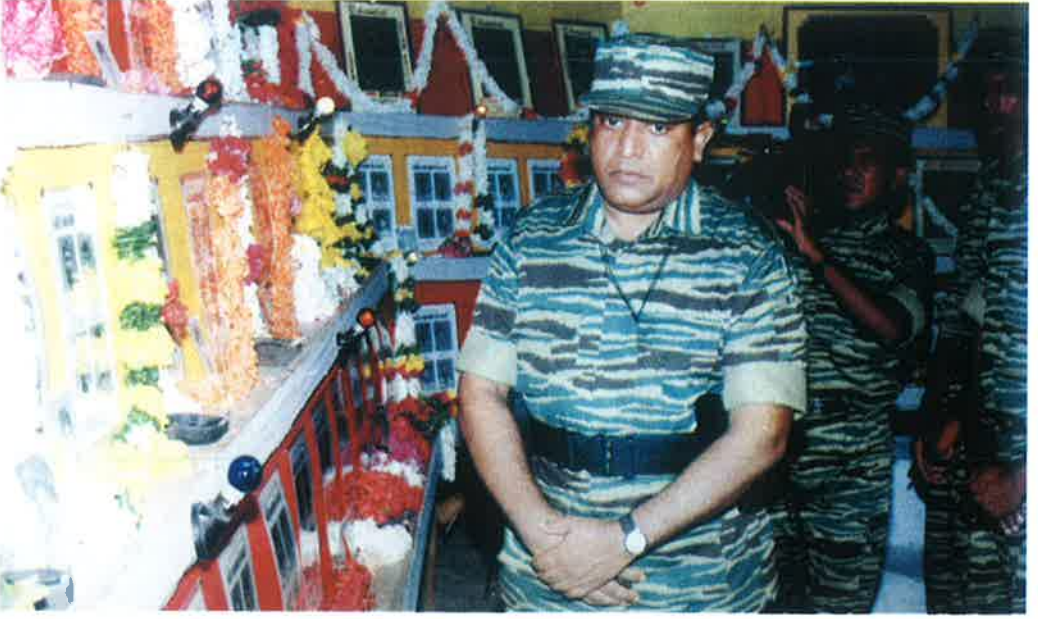
மாவீரர்களின் உருவப்படங்களைத் தலைவர் பார்வையிடுகின்றார்