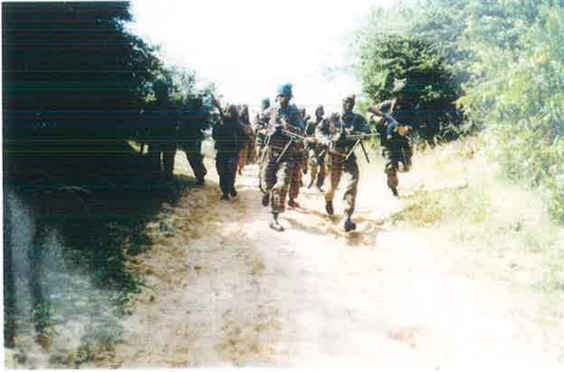
திருமலையில் எங்கள் படையணி

எமது இயக்கத்தின் முதலாவது மரபுவழித் தாக்குதற் படையணி ஒரு மரபுவழித் தாக்குதலுக்கான களநிலையை ஏற்படுத்துவ தற்காகத் திருமலை நோக்கிப் புறப்படத் தயாரானது. அணிக்குப் பொறுப்பாகப்