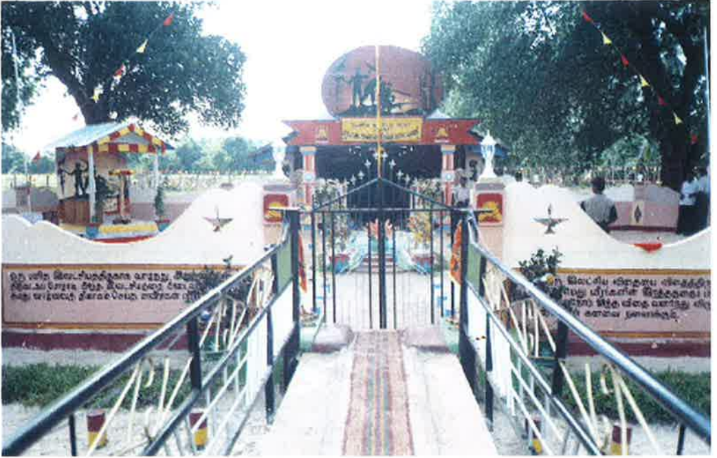
நினைவாலயத்தின் வெளிமுகத் தோற்றம்