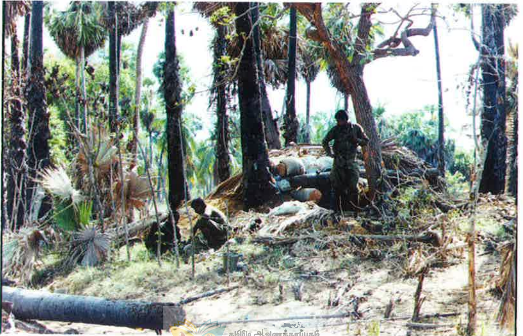
அக்கினிக்கேலாவை வென்றது திரும்பும் எம் வீரர்கள்