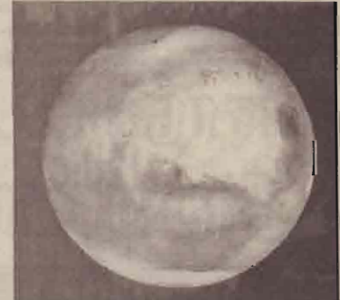
நாசா விண்வெளி ஆய்வு நிலையத்தால் வெளியிடப்பட்டுள்ள "செவ்வாய்" கோளின் புகைப்படம் - புவிவீலிருந்து ஏறக் குறைவாக 43 மில்லியன் மைல் தொலைவில் இது காணப்படுகிறது.