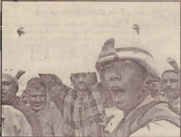
வேலை நீக்கப்பட்ட ஈராக்கிய இராணுவ வீரர்கள் பாக்தாத் தீவுள்ள அமெரிக்க இராணுவத் தலைமையகத்தின் முன் உங்களுக்கு கொடுப்பனவுகளை வழங்குமாறு ஆர்ப்பாட்டத்தில் ஈடுபடுகின்றார்கள்.

படையினருக்கும் இடையே மோதல்கள் இடம்பெற்றுள்ளன.