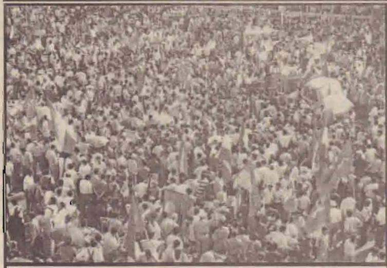
நேபாள மன்னர் பரம்பரையினர் படுகொலைச் சம்பவத்தின் 2ஆவது வருட நினைவு நாள் மாணவர்களும் எதிர்க்கட்சிகளும் மன்னர் கயேந்திராவிடம் அரசியல் தீருத்தத்துக்கு அழுத்தம் தெரிவித்து ஆர்ப்பாட்டம் செய்கின்றனர்.