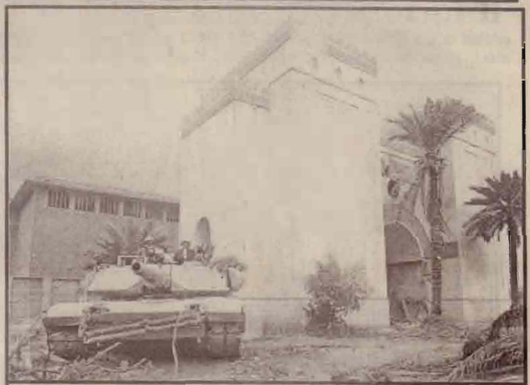
பாக்தாத்தில் அரும்பொருள் காட்சிச்சாலை கட்டடத் தருகே நிலையெடுத்துள்ள அமெரிக்க இராணுவ டாங்கி

கள் சோதனை நடவடிக்கைகளை ஆரம்பிப்பர் என்றும் அவர் மேலும் தெரிவித்தார்.