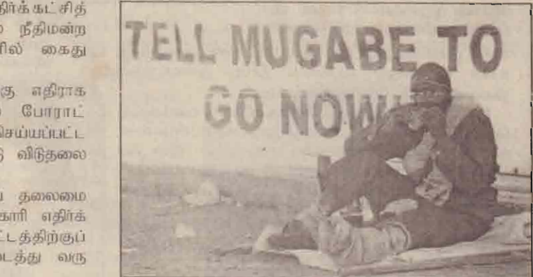
ஜொகாரின்ஸ்பேர்க் நகரில் நடந்த சிம்பாவே நாட்டின் எதிர்க்கட்சிகளின் கூட்டம் ஒன்றின் போது "முகாபேயை வெளியேறச் சொல்" என்ற வாசகத்திற்கருகே உணவருந்தும் தென்னாபிரிக்கர் ஒருவர்

இதேபோன்று சிம்பாவேயின் பல பகுதிகளில் போராட்டத்தில் ஈடுபட்டவர்களுக்கும்