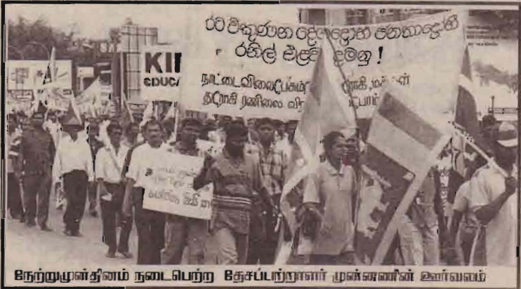
நேற்றுமுன்தினம் நடைபெற்ற தேசப்பற்றுள்ள முன்னணியின் உள்வயம்

கொழும்பு பி.பி.ஸி செய்தியாளர் (லண்டன்) இராணுவத்தின் மீது பிரதமர் ரணில் விக்ரமசிங்கவிற்கு கட்டுப்பாடுகள் இல்லாத சூழ்நிலையில் விடுதலைப்புலிகளுடன் சமரச முயற்சிகளை மேற்கொள்வது கடினமாகவே இருக்கும் என்று பி.பி.சி. தமிழோசையின் கொழும்பு முகவர் கருத்துத் தெரிவித்துள்ளார். நாட்டின் பாதுகாப்பிற்கான அதிகாரங்களைக் கைப்பற்றியுள்ள சனாதிபதி சந்திரிகா குமாரதுங்க அவற்றை மீண்டும் கையளிப்பதற்கான திட்டம்தெவும் தனக்கு கிடையாது என்றும் கூறியுள்ளது தெரிந்ததே. இதேவேளை நோர்வேத் தரப்பினர் சமாதான முயற்சியின் ஏற்பாட்டாளர்கள் என்ற தமது பங்களிப்பின் எல்லையைக்கடந்து செயற்படுகிறார்கள் என்று சனாதிபதி நினைக்க (8 ஆம் பக்கம் பார்க்க)