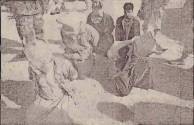
ஈராக்கின் மெய்டன் என்ற கிராமத்தில் அதிகாலை வேளை அமெரிக்கப் படையினர் நடத்திய தேடுதலில் கைது செய்யப்பட்ட ஈராக்கியர்கள். இவர்கள் தாக்குதல் ஒன்றின் பின் கைது செய்யப்பட்டதாக தெரிவிக்கப்பட்டது.