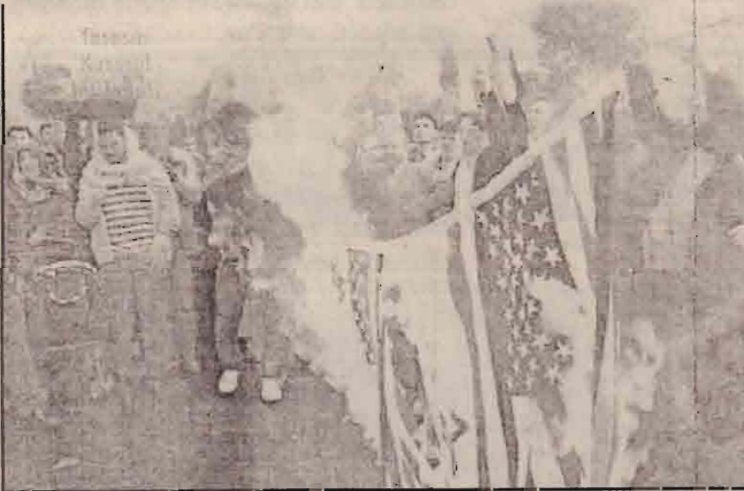
ஈராக்கிற்கு தூக்குச்சிப் படைகளை அனுப்ப முன்வந்துள்ளதை அடுத்து தலைநகர் இஸ்தான்புலில் அதற்கு எதிர்ப்புத் தெரிவிக்கும் துருக்கிய முஸ்லிம்கள் அமெரிக்க இஸ்ரேலிய கொடிகளை எரியூட்டுகின்றனர்.