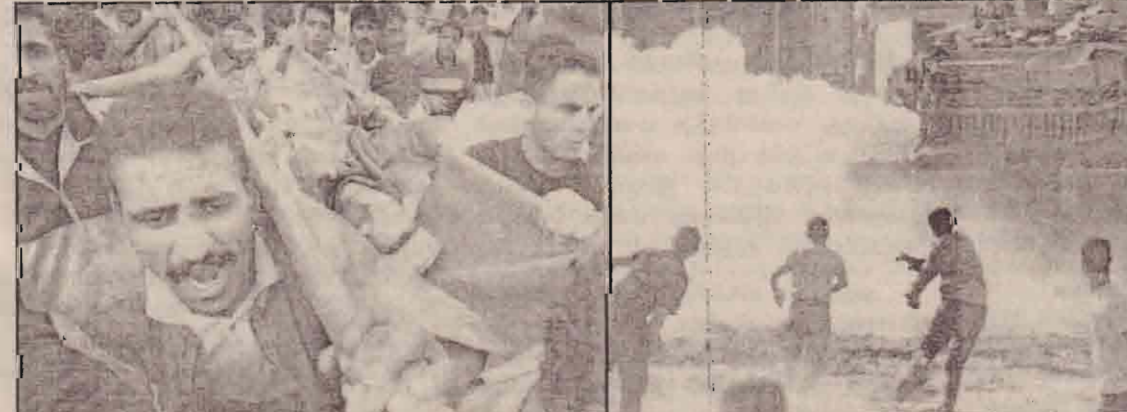
இஸ்ரேலியப் படையினரால் காசாவில் கொல்லப்பட்ட 10வயது பலஸ்தீன் சிறுவனின் இறுதி ஊர்வலத்தையும் மேற்குக் கரையில் பலஸ்தீன் இளைஞர்கள் இஸ்ரேலிய டாங்கி மீது சுற்களை வீசும் தாக்குவனையும் படங்களில் காண்க.

கட்டுப்படுத்தும் மருந்தை 2 ஆண்டுகளில் கண்டுபிடிக்க முடியும் என்றும், அப்படி முடியாது விட்டால் தமது ஆயாய்ச்சிப் பணி மேலும் ஓராண்டுக்கு நீடிக்கலாம் என்றும் கூறியுள்ளார். அதே வேளை சுகாதார ரீதியிலான பாதுகாப்புப் பணிகள் சீராக இருந்தால் சார்ஸ் இனி ஏற்படாது தவிர்ந்து விடலாம் என்றும் அவர் கூறியுள்ளார்.