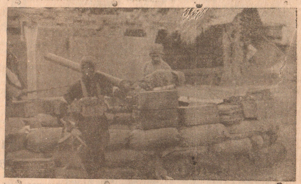
பூநகரி முகாமைத் தகர்த்த பின்னர் அங்கிருந்த கனரக ஆயுத மொன்றை போராளி ஒருவர் எடுத்துச் செல்வதைப் படத்தில் காணலாம்.