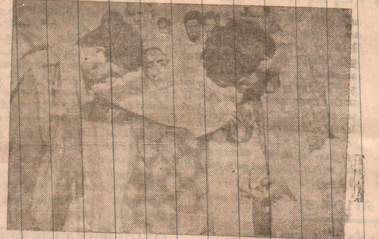
‘எல்லை தாண்டும் பேரணிக்கு’ தனது புதல்வர்களை ஆசீர்வதித்து அனுப்பும் தாய். இச்சம்பவம் ஆலாத் காஷ்மீரின் தலைநகரான முசாபராபாத்தில் நடைபெற்றது.

ஜம்மு காஷ்மீர் விடுதலை முன்னணி எல்லை தாண்டும்