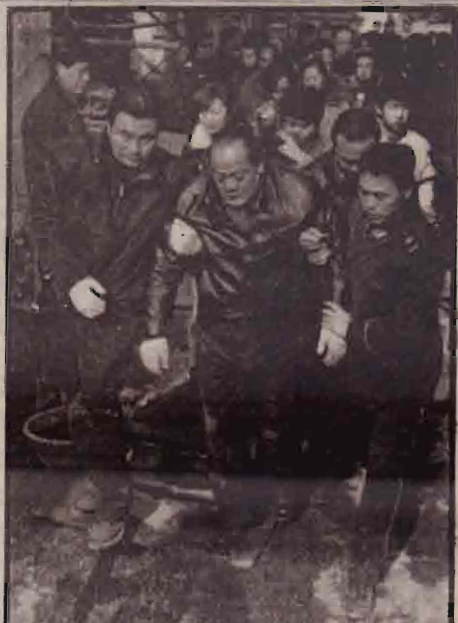
சீனாவின் ஜியான் நகரில் அரசுக்கு எதிராக நடைபெற்று போராட்டத்தில் பங்கேற்றவரைப் பொலிசார் பிடித்துச் செல்கின்றனர்.