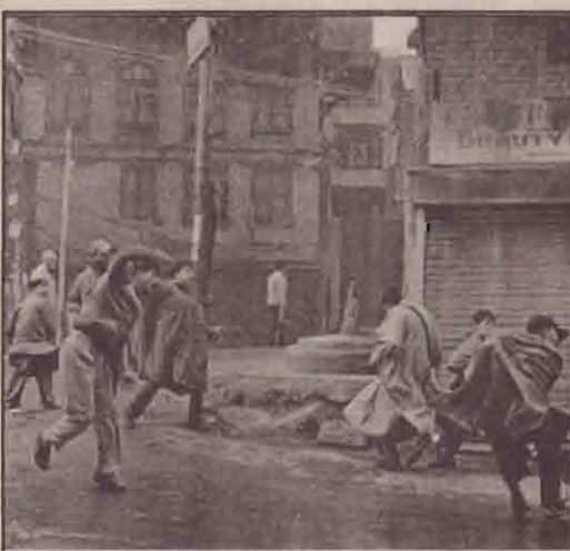
காஷ்மீரில் பொலீஸின் அராஜகப் போக்கைக் கண்டித்து ஆர்ப்பாட்டக் கார்கள் போராட்டத்தில் குத்தினர். போராட்டத்தில் குத்தினவர்கள் பொலீஸுக்கு எதிராகக் கல்வீசில் ஈடுபட்ட போராட்டம் கலராமாக மாறியது.

அதபோல் உத்தரப்பிரதேச மாநில முதல் மந்திரி முலாயம்சிங் சொத்துக் கணக்கை காட்டத் தயாரா? தோரலில் போட்டியிட வேட்டி மனுத் தாக்கல் செய்த போது அவர் சொத்துக் கணக்கைக் காட்டியுள்ளார். இப்போது புதிதாக சொத்துக் கணக்கு காட்டுவதில் என்ன தவறு? அவரது சொத்துக் கணக்கு குறித்து கேள்வி எழுப்பப்படும்தோது அவர் தாய்மையானவராக தன்னை நினைக்க வேண்டும். அதைவிட்டுவிட்டு, அவர் இந்தப் பிரச்சினையைத் தவிர்ப்பது ஏன் என்று புரியவில்லை. எனத் தெரிவித்தார்.