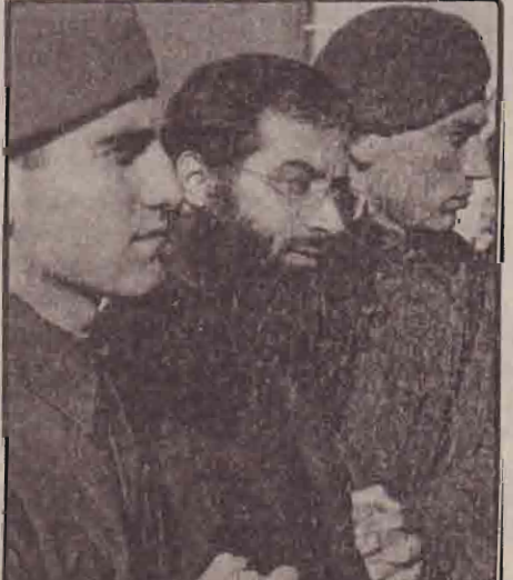
2003 துருக்கியில் நடந்த தொடர் குண்டு வெடிப்புக்குக் காரணமான அல்ஹைதா தீவிரவாதி பெல்ஸ் இடிசை துருக்கிப் பொலிசார் இஸ்தான் பூல் நீதிமன்றத்திற்கு அழைத்து வந்தனர்.

இந்த வெடி குண்டுத் தாக்குதல் தொடர்பாக ஏற்கனவே நான்கு பேரை லண்டன் பொலிசார் கைது செய்தனர். வேறு சிலரைப் பொலிசார் தேடி வந்தனர். இந்த வழக்கில் 21 பேர் மீது லண்டன் பொலிசார் வழக்குப்பதிவு செய்துள்ளனர். இந்த வழக்கில் தேடப்பட்டு வந்த முக்கிய குற்றவாளி நேற்று முன்தினம் லண்டனில் கைது செய்யப்பட்டார். வெடி குண்டுத் தாக்குதல் நடத்திவிட்டு வெளிநாட்டுக்குத் தப்பி ஓடியவர் ஆறு மாதங்களுக்கு மேலாக தலைமறைவாக இருந்தார். எதிர்பார்ப்பிய நாட்டின் ஆடிஸ் அப்பாஸ் நகரில் இருந்து விமானத்தில் லண்டன் வந்து சேர்ந்த அவரை விமான நிலையத்திலேயே பொலிசார் கைது செய்தனர். லண்டன் நகரில் மீண்டும் வெடி குண்டுத் தாக்குதல் நடத்தும் திட்டத்துடன் அவர் வந்ததாகவும் பொலிசார் தெரிவித்துள்ளனர். ஆனால் அவரது பெயரைப் பொலிசார் வெளியிடவில்லை.