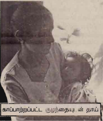
காப்பற்றப்பட்ட குழந்தைகள் தாய்

(அலுவலக செய்தியாளர்) பாதுகாப்பற்ற கிணற்றில் விழுந்த