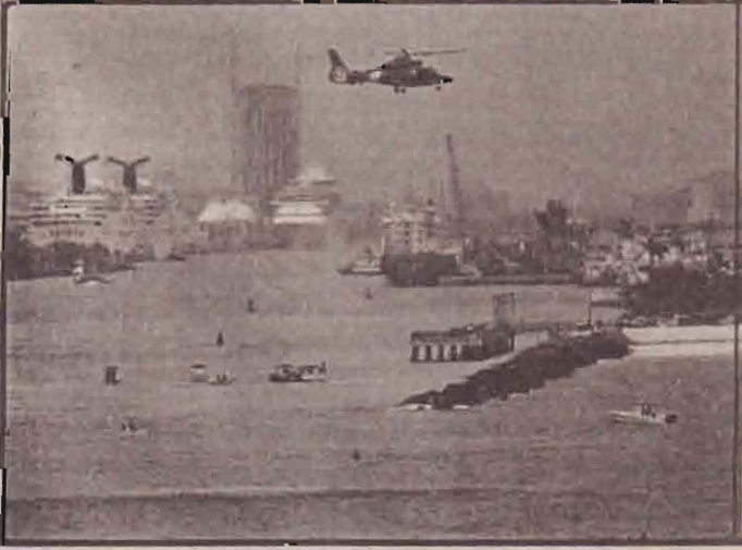
அமெரிக்க, மிராமீ கடற்கரைப் பகுதியில் நேற்று முன்தினம் விமானம் டுலாண்டில் வெடித்துச் சிதறியது. இதில் பயணம் செய்த 20 பேர்பரிசியினர். சம்பவம் நடந்த இடத்தில் உலங்குவானூர்தி மற்றும் படகுகள் மூலம் தேடும் பணியில் ஈடுபட்டுள்ளமீட்டிங் குழுவினர்.

கூடமைக்குச் சென்றுகொண்டிருந்த போதே கடத்தப்பட்டுள்ளனர். இதே வேளை பலஸ்தீனத்தில் எதிர்வரும் கணம் மாதம் பராமுஹ்மீத்பொதுத்தீர்தல் நடைபெறவுள்ள நேரத்தில் நடைபெறும் இவ்வாறான சம்பவங்களை பலஸ்தீன சனாதிபதி யோசை அப்பாஸ் கட்டுப்படுத்தத் தவறினால் அவர் பரீய நெருக்கடிக்கு முகம் கொடுக்க வேண்டி ஏற்படுமென அவதானிகள் கூறியுள்ளனர்.