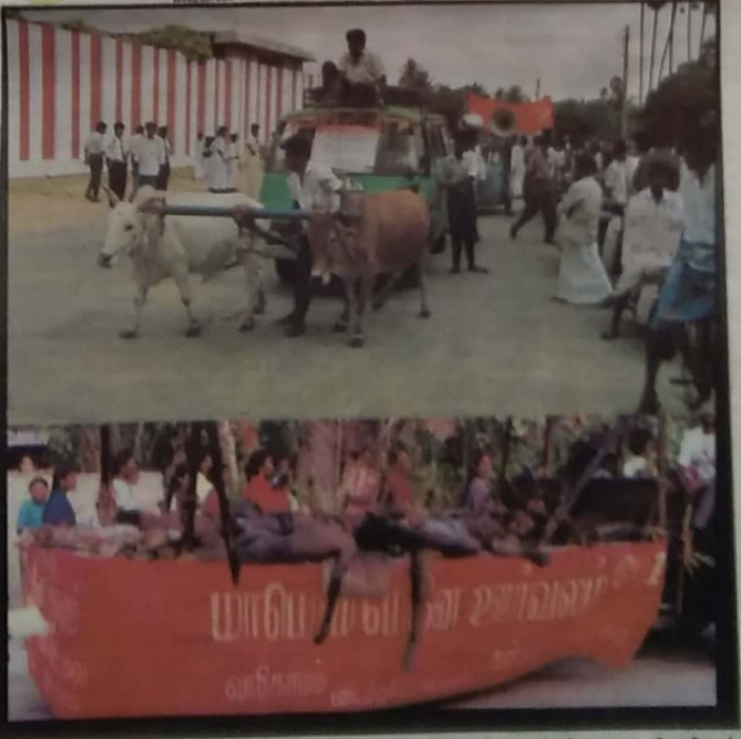
டீட்டிவினியைத் தமிழ்நாடு பிரதேசங்களில் தொழிலாளர் தினமான மேதினம் கோலாகலமாகக் கொண்டாடப்பட்டது.

அரசாங்க மாற்றங்களோ - அரசியல் தலைவர்களின் மறைவுகளோ - தமிழ் மக்களைப் பொறுத்தவரையில் பெரிதான மாற்றங்கள் ஏதாவதும் கொண்டு வருவதில்லை என்பதை கிட்டத்தட்ட 40 ஆண்டுகால வரலாறு தெரிவிக்கின்றது. காரணம் - தமிழ் மக்களுக்கு ஏதிரான இனவாதம் தற்கு முன்போய்ப் போயுள்ளதேயாகும். எனவே தனது திபி பிரேமதாசாவின் மரணத்தின் பின்னரும் - தமிழ் மக்களின் அபிமானத்தைப் புரிந்துகொண்டு - அதனுடைய உயில் சமாதானம், சௌதுக்ய ரீதியில் பிரச்சனைகளைத் தீர்க்கக் கொண்டு வரக்கூடிய அரசியல் தலைமை சிபிஐ மக்களிடையே உடனடியாகத் தொடர்ச்சி 1வம் பக்கம்