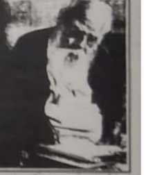
பொதுமக்களின் உணர்வில் எழுந்த இத்தகைய இந்தி மொழித் திண்ப்புக்கு எதிரான உணர்வை வற்புடாததில் செல்வந்தருக்கு தமிழகத்தின் இன்று இளவணர்வுகள் தலைவர்களாகத் தோவலவலச் வேண்டியுள்ளது.

எனக்கு அச்சுணர்வை ஏற்படுத்தியது. பெரியார் விதைத்த உண்மைக்குத்தக்கம் மறைந்து போகாதது மிக முக மன்னிய இத்தகைய உணர்வு எழுவது தியல்பே.