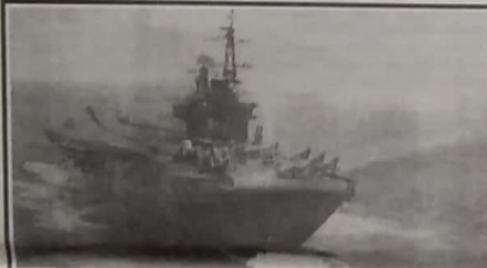
பாராட் துருப்பினரைத் தரைபிழங்குவந்தவகையாக பயன்படுத்தும் வானங்கள் பிறகாலத்தில் ஏதிரி வானங்களின் ஊடுருவலைத் தடுப்பதற்காக வானச் சண்டைக்கு ஏற்றவழி அமைக்கப்பட்டன.

தேச அமைதியின் பிராங்கல், இத்தாலி, பெல்ஜியம் ஆகிய பெற்றிகளுக்கு இவ்வாறியினரின் மெய்திக்கமே காரணமாக இருந்தது. சண்டையில் தீண்டாமை அடங்கிய ஜேர்மனி தனது வானப்படையினர் இரண்டாம் ஏதிரிக்கு திராக ஈடு செல்லும் தவறியதும் இவ்வெறிக்களுக்கு காரணமாக இருந்தது.