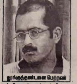
புரூக்ஷ் தண்டனை பெற்றவர்

இந்தியப் பாராளுமன்றத்தை தாக்கிய வழக்கில் பாகிஸ்தான் தீவிரவாதிக் குழுக்கு தண்டனையை உறுதி செய்தும், ஒருவருக்கு பத்தாண்டு சிறை தண்டனை விதித்தும் பெண் உட்பட இரண்டு பேரை விடுதலை செய்தும் உயர்நீதிமன்றம் தீர்ப்புக் கூறியுள்ளது.