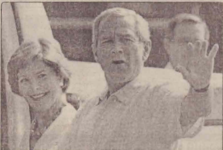
கிறேபோட்டி மனைவி மூறாபுஷ்குடன் நடந்து செல்லும் ஜோடி பிளீயு புஷ் பார்வையாளரை தோக்கிக் கைகாசிக்கின்றார்.

பாகிஸ்தானில் இப்போது அல்-ஹைதா தீவிரவாத இயக்கம் இல்லை. அது முற்றிலுமாக அழிக்கப்பட்டுவிட்டது. லண்டனில் நடந்த தீவிரவாதத் தாக்குதலுக்கு ஒருவேளை பின்னிலேன் நேரடியாக உத்தரவு பிறப்பித்து இருக்கலாம் இவ்வாறு முஹரப் கூறினார்.