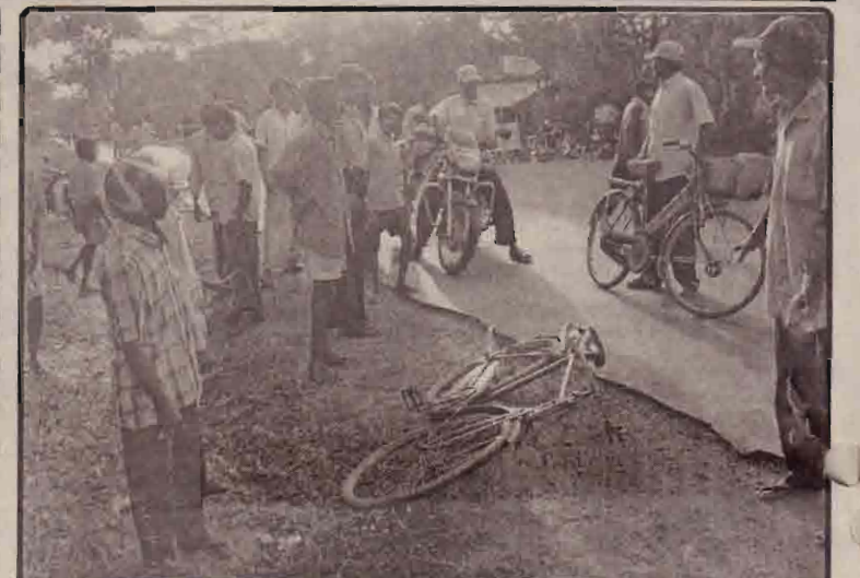
நேற்று முன்தினம் கிளிநொச்சி டிப்போவீதியில் சேவியர்கடைச் சந்திக்கு அருகாமையிலுள்ள சந்தைக்கு முன்பாக ஈடுருளி. உந்துருளி விபத்தில் ஈடுருளி சேதத்திற்குள்ளாகி வீதியில் கிடப்பதனைப் படத்தில் காணலாம்.