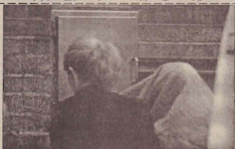
கடந்த 21 ஆம் திகதி லண்டன் தாக்குதல் சந்தேக நபர் தலையை மூடியவன்வரும், வாலிசாரிற் தகவல் வழங்கத்தவறிய பெண்மணியும் நிதியின்றத்திற்குத் தமது வாக்கு நீவத்தை வழங்கச் செக்கின்றனர்.

அமெரிக்காவுக்குள் சட்டவிரோதமாக நுழையவர்களுக்கும், விசா காலம் முடிந்த பிறகு அமெரிக்காவிலேயே தொடர்ந்து தங்கி இருப்பவர்களையும் கண்டுபிடிக்க வகையையும் விதிமுறைகளும் இந்தப் புதிய சட்டத்தில் இடம் பெற்றுள்ளன.