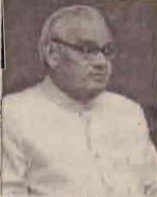
பொக்ராவில் அணுகுண்டு சோதனை

அணுசக்திக் கொள்கையை கடைப்பிடித்து வந்தது - முன்னாள் இந். பிரதமர் வாஜ்பாய்