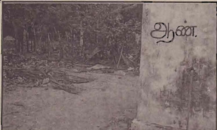
கிளிநொச்சி பொதுச்சந்தை வளாகத்தில் அமைந்துள்ள மலசல கூடம் முன்பாக குப்பை கூழங்கள் அகற்றப்படாது இருப்பதனைப் படத்தில் காணலாம்.