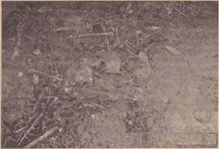
யாகவுள்ள இராணுவ காவலரன் அமைந்திருந்த காணிக்ுகள் இருந்து இரண்டு எலும்புக்கூடுகள் காணியிருந்தே இந்த மனித எழுப்புக் கூடுகள் கண்டு பிடிக்கப்பட்டுள்ளன. குறித்த காணியிலிருந்து படையினர் அண்மையில் வெளியேறிய நிலையில் அதனைத் துப்பரவு செய்து கொண்டிருந்த அதன் உரிமையாளர் இந்த எழுப்புக் கூடுகளைக் கண்டு பிடித்துள்ளார்.

உரிமையாளரினால் கண்டுபிடிக்கப்பட்டுள்ள. நீண்ட நாட்கள் படையினரின் ஆக்கிரமிப்பிலிருந்து காணியி