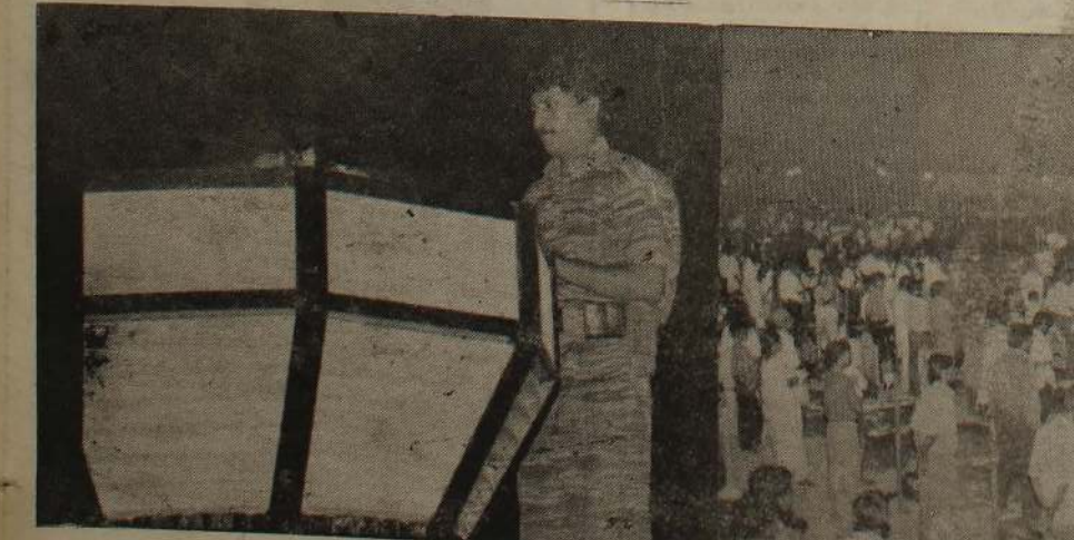
கோப்பாய் மாவீரர் துயிலும் இல்லத்தில் மூத்த தளபதி பொட்டமொள் பொதுக்கூட ஏற்றிவைப்பதை முதலாவது படத்திலும், மாவீரரின் கல்லறைகளுக்கு பெற்றோர் கடரேற்றி அஞ்சலிசெலுத்துவதை இரண்டாவது படத்திலும் காணலாம்.

ஒரு பக்கம் தமிழர்களுக்கு உரிமைகள் வழங்குகின்றோம் என்று சொல்லிக் கொண்டு ஒருபக்கம் இராணுவத்தை பலப்படுத்தி எம்மை இராணுவ ரீதியாக அச்சுறுத்தி ஒரு தீர்வுக்கு கொண்டு வரலாம் என சிங்கள அரசு என்னிக்கு நடைபெற்றது. அவ்வாறு நேற்று மாவீரர் நாளன்பொதுக்கூட்டத்தில் கலந்துகொண்டுபெறும் அரசியற் துறைப் போரப்பாளர் சு.ப. தமிழ்ச்செல்வன் தெரிவித்தார். மேலும் அவர் பேசுகையில், இன்று சமாதானத்தைப் பற்றி பேசிக்கொண்டிருக்கிறோம் சமாதானம் வரும் சிறிது கிடைக்கும் என்று பலரும் பேசிக் கொண்டிருக்கிறோம். நாமும் அதைத் தான் எதிர்பார்த்தோம். சிங்கள அரசு மாறி இருக்கின்றது. புதியதோர் இனவாதம் பேசாத அரசு ஆட்சிபட்டம் ஏறியிருக்கிறது. இந்த அறிவிப்பு சிங்கள மக்கள் அங்கோரம் கொடுத்திருக்கிறார்கள். அதாவது தமிழ் மக்களுக்கான உரிமைகளை கொடுக்கலாம் என்று. இனவாதம் பேசியவர்கள் எல்லாம் முடிக்கப்பட்டுட்டார்கள் நாமும் இதைத்தான் எதிர்பார்த்தோம். சத்திரகா (5 ஆம் பக்கம் பார்க்க)