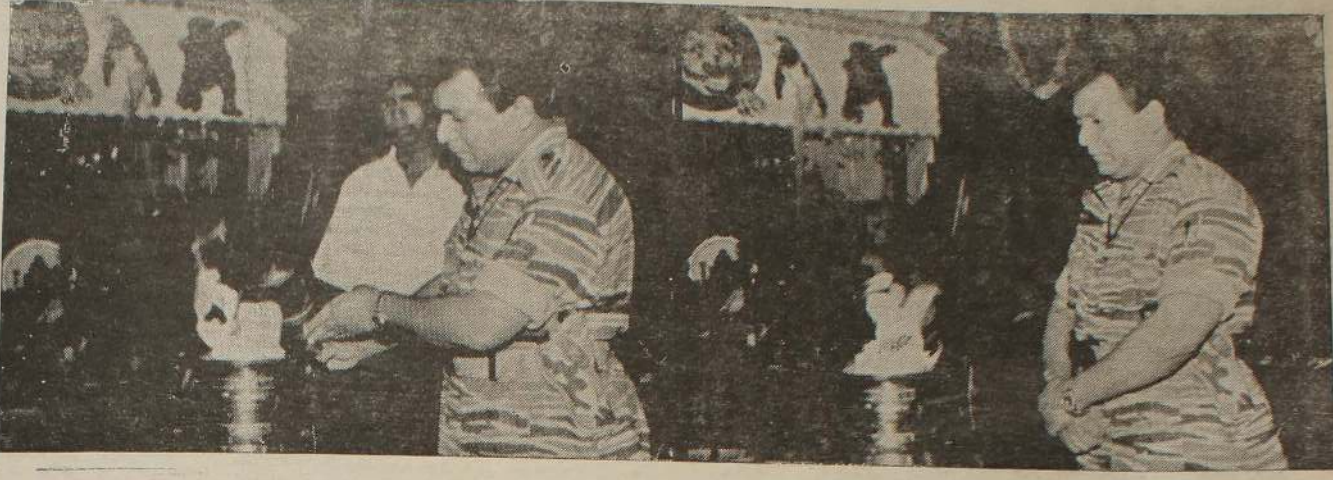
மாவீரர் தினத்தை முன்னிட்டு தேசியத் தலைவர் பிரபாகரன் புலிகளின் படை முகாம் ஒன்றில் நினைவுச் சூடர் ஏற்றுவதை முதலாவது படத்திலும், மொளைய அஞ்சலி செலுத்துவதை இரண்டாவது படத்திலும் காணலாம்.

கடற்படையின் அணிவகுப்பில் ஆண்-பெண் போராணிகளும் ஈடுபட்டனர். இவர்கள் கைகளில் ஆயுதம் ஏந்தி அணிவகுப்பில் ஈடுபட்டனர். மூன்றாவதாக காவல்துறையினர் ஆயுதம் ஏந்தி பப்படி அணிவகுப்பில் ஈடுபட்டனர். அடுத்து காந்தர்ப்பு அறிவுச்சோலை மாணவர்கள் அணிவகுப்பில் ஈடுபட்டனர். பச்சைநிறத் தொப்பியுடன் நீலநிற நீளக் கால் சட்டையும் வெள்ளைநிற மேலாடையும் இவர்கள் அணிந்திருந்தனர். விடுதலைப் புலிகளின் (6 ஆம் பக்கம் பார்க்க)