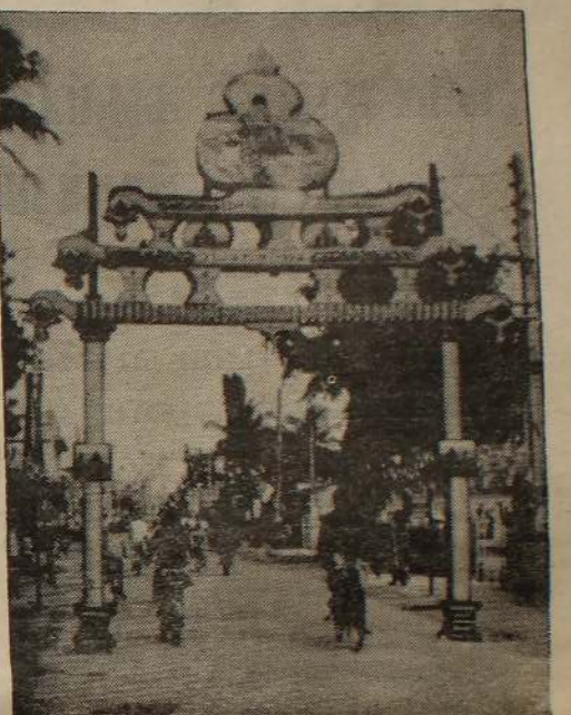
வடமராட்சிப் பகுதியில் அமைக்கப்பட்ட மாவீரர் தின அஞ்சலி வளைவு ஒன்றை மேலே உள்ள படத்தில் காணலாம்.

ஏற்றப்பட்டது. மாவீரர் நினைவுகளை அஞ்சலி செய்தனர். (86)