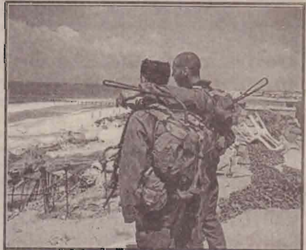
மத்திய துறைக் கடற்பகுதியில் முன்னர் யுதக் குழுவிற்குப் புகுபுகு சிறுந்த தமது முகாம்களை வாபஸ் பெற்று இஸ்ரேலியப் படையினர் கவந்துரையாடுகின்றனர்.