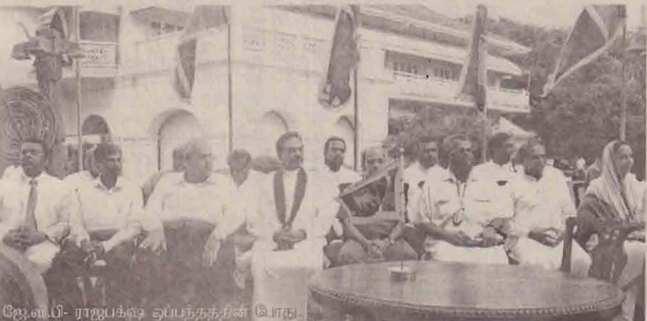
ஜே.வி.பி- ராஜபக்ஷ ஒப்பந்தத்தின் போது.