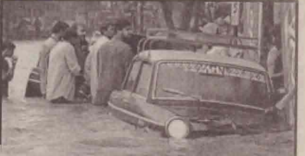
முன்மையின் கீழ் மழை காரணமாக வீதிகளில் மழை நீர் பெருக்கப்பட்டு வருகிறது.

ஜூன் மாதத்தில் இதே இடம் சீலர் கட்டணம் செலுத்தாததால் விமான நிலையத்தை மூட வேண்டிய நிர்ப்பந்தம் ஏற்பட்டது. இதனை தடுக்க முடியவில்லை. இந்த முறையும் திரும்ப நடத்தி இருக்கிறது பண விவகாரம் தொடர்பாக ஈராக் உயரதிக்காரிகளிடம் ஷக்கர் நிறுவன அதிகாரிகள் விடக்கவர்த்தை நடத்தியபாற்றினர். இதுவரை அவர்கள் கட்டணத்தினை செலுத்தவில்லை. அவர்கள் பராமரிப்புக் கட்டணத்தினை செலுத்தியவுடன் விமான நிலையம் போக்குவரத்திற்கு திறந்து விடப்படும்." என்று கூறினார்.