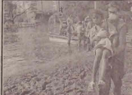
நியூ ஒர்லீயன்ஸில் சூறாவளிக்கு பின் பல மூலம் அழிவுக்கு வரப்பட்ட ஒரு பெருந்திரைக் கொண்டு செல்லப்படுகின்றனர்.

செப்டெம்பர் 11 தாக்குதலுக்கு பின் தீவிரவாத அழிப்புக்கு முக்கியத்துவம் கொடுத்து வந்த அமெரிக்க மக்கள் தற்போது உள்ளூர் பொருளாதாரத்துக்கு முக்கியத்துவம் கொடுக்க வேண்டும் என்று கருதுகின்றனர். அந்தளவுக்கு சூறாவளிப் பாதிப்பு பெரிய தாக்கத்தை ஏற்படுத்தியுள்ளது. சூறாவளி ஏற்படுத்தியுள்ள பொருளாதாரப் பாதிப்பு அனைத்து தர்ப்பு மக்களையும் கவலை கொள்ள செய்துள்ளது என்று கருத்து கணிப்பீடுகள் தெரிவித்துள்ளன.