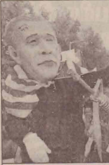
தென்கொரிய தலைநகர் - சயோலில் நடைபெற்ற யுத்த எதிர்ப்புப் போராட்டத்தின்போது ஜேசர்ஜ் புஷ் தென்கொரிய சனாதிபதி ரோ-மு ஹ்யுன் யோன்-ரோரின் முகமூடிகளை அணிந்து காணப்படும் ஆர்ப்பாட்டக்காரர்கள்.