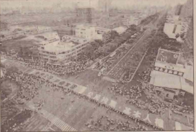
மக்கள் கருத்தைக்கோரும் வகையிலான பதாகையை ஏந்தி ஆர்ப்பாட்டத்தில் ஈடுபடும் தாய்வான் வர்த்தகர்கள்.

நிதிபதிகளும் ராணுவ ஆட்சி அமைப்பதற்கு பொறுப்பானவர்கள் என்பதால் அவர்கள் மீது நடவடிக்கை எடுக்கப்படும் என்றும் அவர் குறிப்பிட்டுள்ளார்.