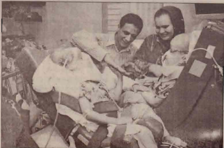
இருவாரங்களுக்கு முன் தலைப்பகுதி ஓட்டியநிலையிலிருந்து எகிப்திய இரட்டைக் குழந்தைகள் பிரிக்கப்பட்ட நிலையில் காணப்படுகின்றனர்.

க்கப்படை வீரர்கள் நான்கு நாள் கொல்லப்பட்டு வருவதையடுத்து அமெரிக்காவில் யுத்த எதிர்ப்புப் பிரச்சாரம் வலுவடைந்து வருகின்றது.