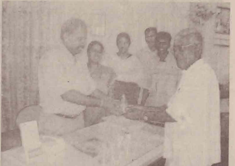
கடந்த தீயால் தீயடைந்த ஊர் கொச்சி மக்கள் வங்கிக்குள்ளில் ரூபா 10,00,000 சேமிப்பீட்டை வங்கிக்குக் கொச்சி மக்கள் வங்கிக்குள்ளே முகாமையாளர்னால் குத்துவீடுக்கு அன்பளிப்புச் செய்யப்பட்டுள்ளது. (டீம் - சோது)

வாழ்ந்து வரும் மக்களுக்கு மிதி வெடி அபாயம் பெரும் தாக்கத்தை உருவாக்கியுள்ள தன்மையையும் கட்டிக்காட்டியுள்ளது. (33)