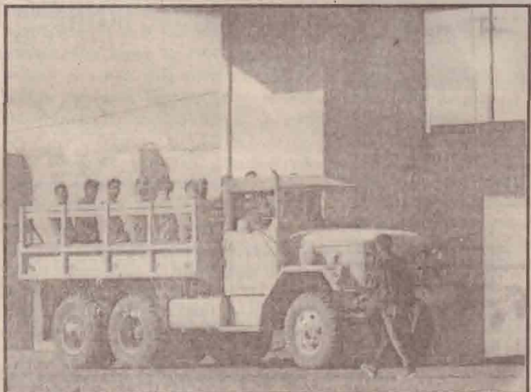
சதாம் ஆட்சியின்போது அரசியல் கைதிகளின் சிறைக் கூடமாகக் கருதப்பட்ட கட்டிடத்தில் இருந்து வேறிடத்துக்கு அமெரிக்கப் படையினரால் கொண்டுசெல்லப்படும் ஈராக்கியக் கைதிகள்.