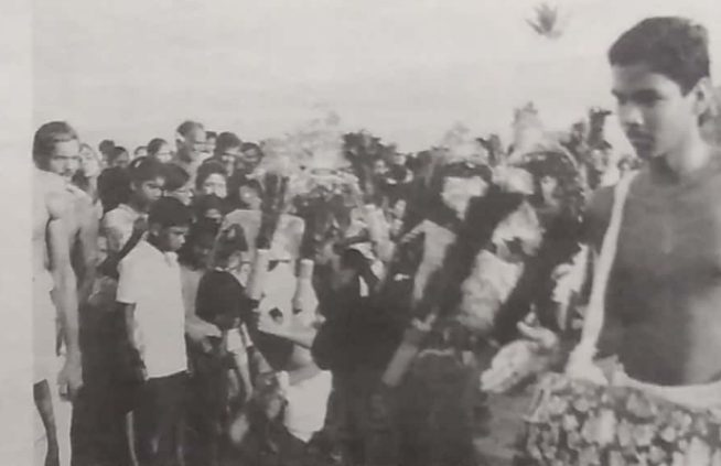
தமிழ் தேசிய இன நடவடிக்கை காரணமாக

இலங்கையில் "பெருந்தேசியவாதம்" என்ற பதமே சொதுவாகப் பயன்படுத்தப்பட்டுவந்தது. National Chauvinism என்ற பதத்தின் தமிழ் மொழி பெயர்ப்பே இதுவாகும். "சோவியீஸம்" என்ற பதம் பல இடங்களில் பயன்படுத்தப்பட்டுவந்தது. Male Chauvinism என்பதை "ஆண் மோலாதிக்கம்" என்பதற்குப் பயன்படுத்தும்போது "சமூக சோவியீஸம்" என்றோ பதமுண்டு பேச்சுவழியில் சமத்திரமும் செயலில் சமுதாயத்தின் அனைத்து அறிவாளர்களையும், வளங்களையும் தமது கைகளில் எடுக்க முற்படும் குழுவின்சுருக்கே இப்பதம் பயன்படுத்தப்படுகின்றது. இது "சமூக மோலாதிக்கவாதம்" எனப் பயன்படுத்தப்படுகின்றது.