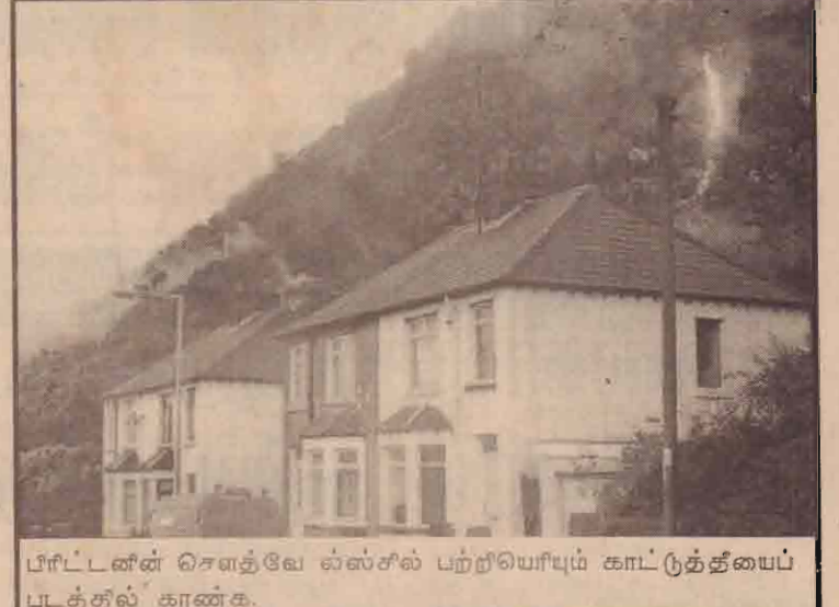
பிரிட்டன் செளத்வே ல்ஸ்சில் பற்றியெரிவும் காட்டுத்தீயைப் படத்தில் காண்க.

(புதுடில்லி) றோடா கருவிகளால் அடையாளம் காணமுடியாத கப்பலை இந்தியா தயாரித்துள்ளது. 'சிவாலிக்' என்று பெயரிடப்பட்டுள்ள இந்தக் கப்பல் முற்றிலுமாக இந்தியாவில் தயாரிக்கப்பட்டது எனவும் 2005ம் ஆண்டு இக்கப்பல் கடற்படையிடம் ஒப்படைக்கப்படும் எனவும் கூறப்படுகின்றது. இந்தக் கப்பலைத் தயாரித்திருப்பதன் மூலம் இது போன்ற