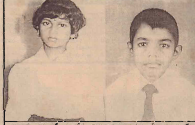
மரதன் ஒட்டப்போட்டியில் சாதனை படைத்த சிறுவர்களுடைய படத்தில் காண்கிறீர்கள்.

தியாலம் 58 நிமிடங்களில் ஓடி முடித்து சாதனை படைத்துள்ளார். இம் மரதன் ஒட்டப்போட்டியில் இவர் 12ஆவது இடத்திற்கு வந்தது குறிப்பிடத்தக்கது.