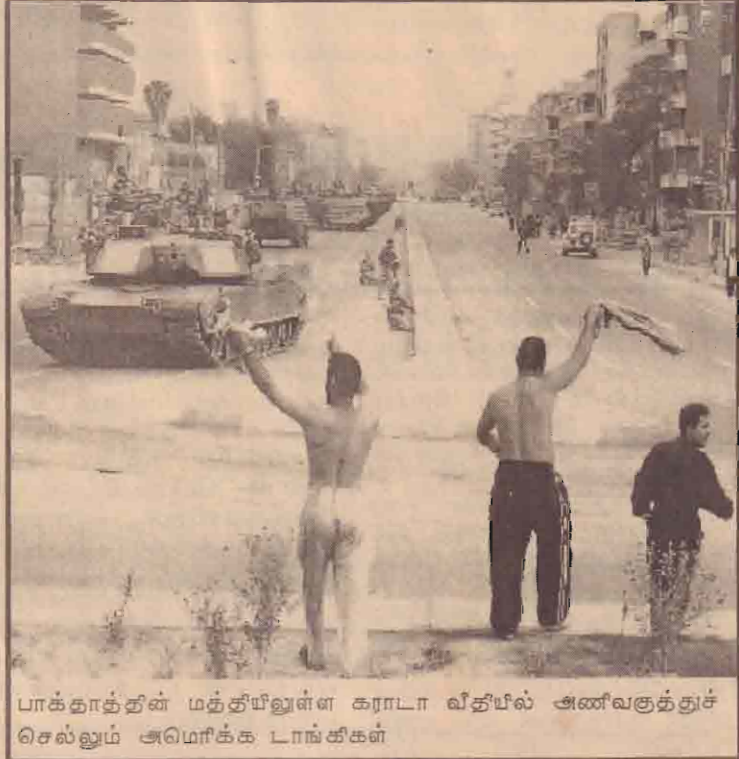
பாக்தாத்தின் மத்தியிலுள்ள கராடா வீதியில் அணிவகுத்துச் செல்லும் அமெரிக்க டாங்கிகள்

எடுத்துள்ளதாகத் தெரிவிக்கப்படுகின்றது. இதேவேளை, மேலும் 7000 யுத்தக் கைதிகளை சிறை வைத்துள்ளதாக அமெரிக்க பாதுகாப்புப் பிரிவினர் தெரிவித்துள்ளனர். இவர்களிலும் விடுதலை செய்யக் கூடியவர்கள் உள்ளனர் என்பது பற்றி ஆராய்ந்து வருவதாக அவர்கள் கூறுகின்றனர். விடுதலை செய்ய முடியாத நிலையில் உள்ளவர்களை ஈராக்கில் ஏற்படுத்தப்படவுள்ள புதிய அரசாங்கத்திடம் ஒப்படைப்பதற்கு அமெரிக்கப் படையினர் உத்தேசித்துள்ளதாகத் தெரிவிக்கப்படுகின்றது. ஜெனீவா உடன்படிக்கைக்கு அமையவே இந்த நடவடிக்கை எடுக்கப்படவுள்ளதாக அமெரிக்கா தெரிவித்துள்ளது.