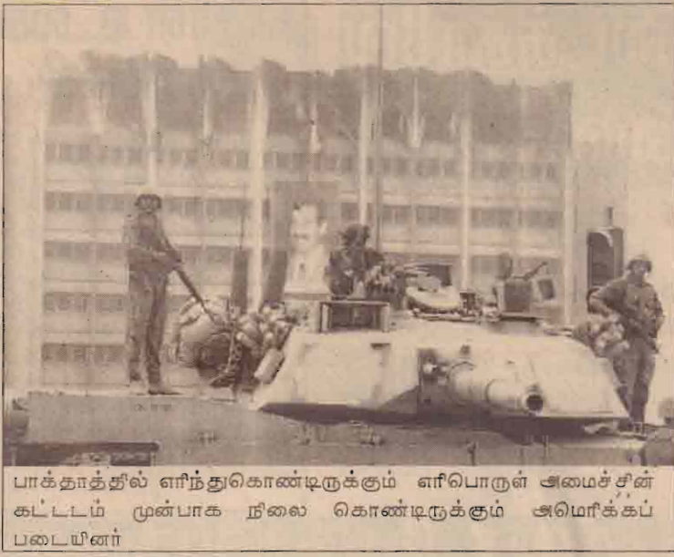
பாக்தாத்தில் எரிந்துகொண்டிருக்கும் எரிபொருள் அமைச்சின் கட்டடம் முன்பாக நிலை கொண்டிருக்கும் அமெரிக்கப் படையினர்