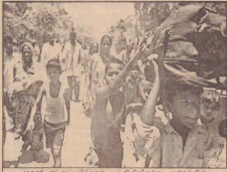
முதார் கட்டைபுரிச்சான் பகுதியிலிருந்து அச்சத்தின் காரணமாக இடம்பெயரும் மக்கள்.