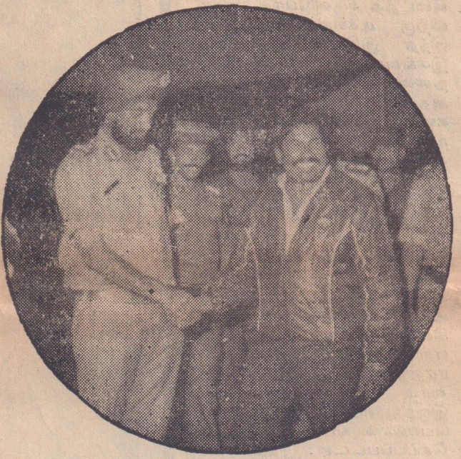
விடுதலைப் புலிகளின் பிரதித்தலைவர் மாத்தயா விடம் இருந்து போரின் போது கைதாகிய இந்திய சிப்பாய்களை இந்திய இராணுவ அதிகாரி பொறுப்பேற்றார்.

“இந்தியா விட்டமாபெரும் தவறு என்னவெனில் இந்தியப் படைகளை இலங்கைக்கு அனுப்பியமையே” என வி. பி. சிங் பிரதமராக வந்தபின் டிசம்பர் 5 ஆம் திகதி கூறிய மையே அமைதிப்படை” யினதும் இந்திய அரசினதும் தோல்வியை அப்படியே ஒப்புக்கொண்டுள்ளமையை காட்டுகின்றது.