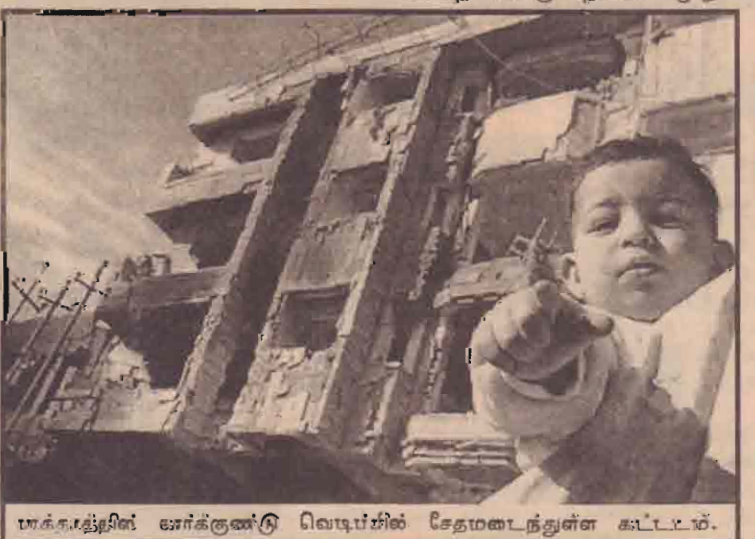
பாக்தாத்தின் ஊர்க்கூலி விவசாயிகள் சேதமடைந்துள்ள கூட்டடம்.

மாலை தீவில் 1192க்கு மேற்பட்ட மலையாள பாரைகள் கொண்ட சிறு தீவுகள் காணப்படுகின்றன. இதனால் உலர்வாசப் பிரயாணிகள் உலகின் பல பாகங்கள் லிருந்து இத்தீவுகளுக்கும் பிரயாணம் மேற்கொள்வது வழமை.