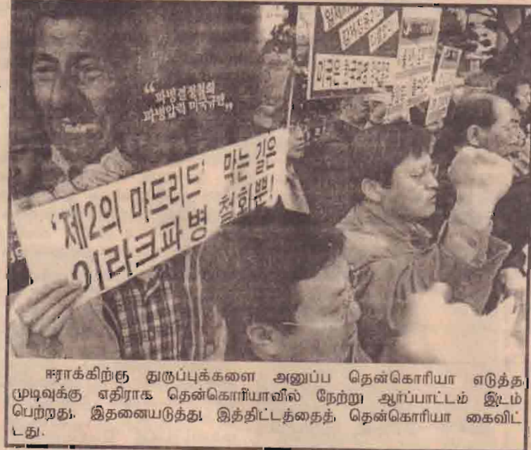
ஈராக்கிற்கு துருப்புக்களை அனுப்ப தென்கொரியா எடுத்த முடிவுக்கு எதிராக தென்கொரியாவில் நேற்று ஆர்ப்பாட்டம் இடம்பெற்றது. இதனையடுத்து இத்திட்டத்தைத் தென்கொரியா கைவிட்டது.

இவ்வாறு அத்வானி செய்தியாளர்களிடம் கூறியுள்ளார்.