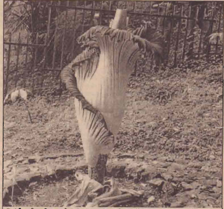
இந்தோனேசியா மேற்கு யாவாவில் 'காகஸ் பிளவர்' என அழைக்கப்படும் இப் பூ அங்குள்ள பூங்காவில் மலர்ந்துள்ளது. இது 9.5 அடி உயரம் கொண்டதும் அசூகிய மாயிசு மணத்தைக் கொண்டதுமாகும். அத்துடன் இது மிக அரிதாகவே காணப்படுவதாக கூறப்படுகிறது. இப் பூ உகைலேயே மிக உயரமான பூவாக பதிவு செய்யப்பட்டுள்ளது.

இந்த முடிவை ஐக்கிய நாடுகள் ஸ்தாபனம் இதுவரை அங்கீகரிக்கவில்லை.