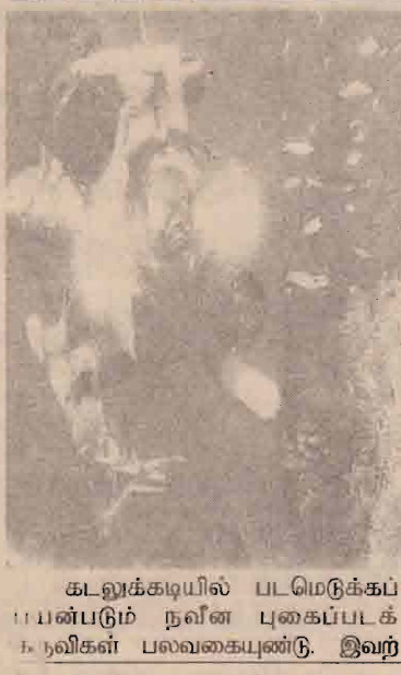
கடலுக்கடியில் படமெடுக்கப் பயன்படும் நவீன புகைப்படக் கருவிகள் பலவகையுண்டு. இவர்

ஆயாட்சி செய்யும் ஆயாட்சியாளர் களுக்கு மிகவும் பயனுடையதாக இருக்கின்றது. இது ஒரு சிறிய நீர்மூழ்கிக் கப்பல் என்று அழைக்கப் படுகின்றது. இந்தக் கருவியில் வீடியோ கமிராக்களும் ஸ்டில் கமிராக்களும் பவர்.புல் விளக்கு களுடனும் பொருத்தப்பட்டுள்ளது. செய்திகளை வாங்கி அனுப்ப "Acoustic Transmeter" கருவி யும் இருக்கின்றது. இந்தவகை கமிராக்களைக் கப்பலில் இருந்த படியே ரிமோட்மூலம் இயங்கச் செய்து எதைபடமெடுக்க வேண்டுமோ அந்தப் பகுதிக்கு இயக்கிச் சென்று துல்லியமாக படம் பதிவு செய்ய முடியும். இந்தக்கருவியில் லேசர்பீம் பயிர்ந்து, கடலின் ஆழத்தில் மேடு, பள்ளமான பகுதிகளை பிரதி பலித்து திரையில் 3D படமாகக் காட்டும் திறன் உடையது.