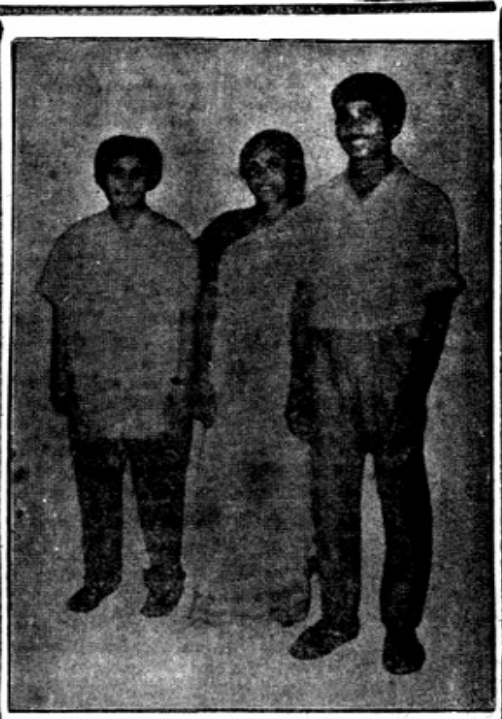
புதுமணி அம்மாவின் பூக்குஞ்சுகள் கய்டன் லிமா, லெப். சேனல் அருளாள்.

விதவைராணியில் இராணுவ அராஜகத்துக்குப் சிங்களகளைப் பறிகொடுத்த பெற்றவயிறுகளின் ஆற்றாமைக் குழறல் - துயர்தாளாப் புலம்பல் இதுவாகத்தானே இருக்கும்! ○