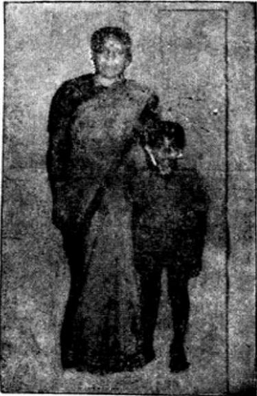
அம்மாவின் (பத்து வயதில்) பிரகாஸ்

கூடையிலிருந்து மாம்பழம் ஒன்றை சீவித்தும்படி தாயிடம் கொடுத்துவிட்டு - பசித்த வயிறும் பசிக்காத மனமுமாய், அம்மா பரிமாற அவன் பசியாழவானான். தாயின் பரிவினும், பரிமாறிய உணவின் குசியிலும் அவன் மனக்கக்கும் பசித்தது.