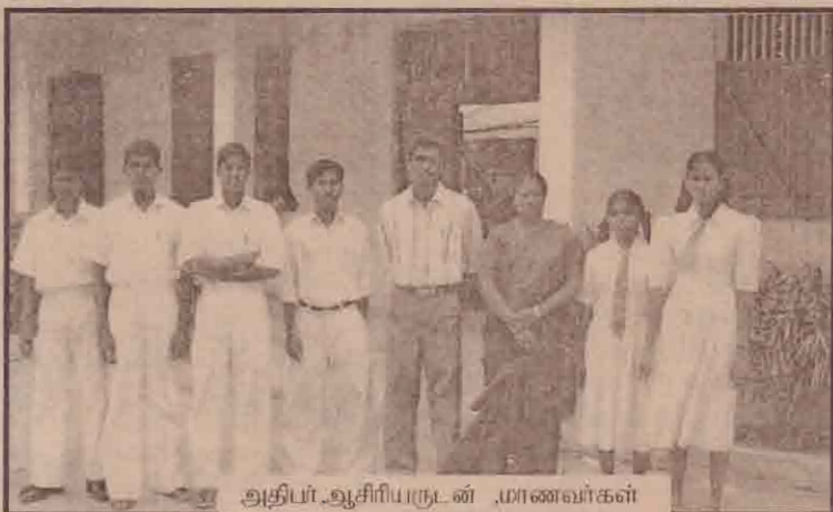
அதிபர் ஆசிரியருடன் மாணவர்கள்

களின் பாவனையினால் மக்களுக்குமண்வளங்களுக்கும் ஏற்பட்டு வரும் தீமைகளை விளக்கிக் கூறி வருவதுடன், இதனால் ஏற்பட