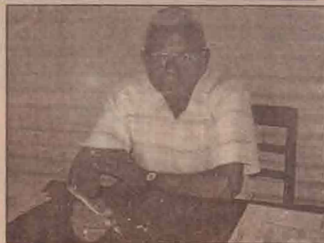
மேற்கொள்வதற்கு குறைந்த பட்சம் ஏழு கோடி ரூபா பணம் தேவைப்படுகின்றது.

கடந்த 12 வருட காலமாக முற்றாகச் சீரழிந்த நிலையிலுள்ள உப்பு விளை நிலங்களினை முற்றாக சீர் செய்யப்பட வேண்டிய