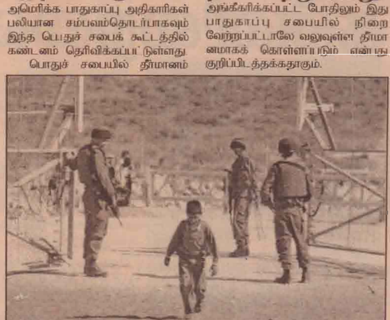
இஸ்ரேலையும் காஸாப் பகுதியையும் பிரிக்கும் வேலியின் வாயில் கதவை பலஸ்தீன பாடசாலைச் சிறுவனுக்காக திறந்துவிடும் இஸ்ரேலிய இராணுவம்.

இஸ்ரேலினால் பாதுகாப்புச் சுவர் அமைக்கப்படும் செயற்பாட்டை ஆட்சேபித்து ஐ.நா. பொதுச் சபையில் அங்கம் வகிக்கும் நாடுகளில் பதினைந்து நாடுகள் கூட்டாக மேற்படி தீர்மானமொன்றை பொதுச் சபையில் சமர்ப்பித்திருந்தன. இது தொடர்பாக பொதுச் சபையில் இடம் பெற்ற விவாதத்தின் ஹூதியில் தீர்மானத்திற்கு ஆதரவாக 144 நாடுகள் வாக்களித்தன. நான்கு நாடுகள் எதிர்த்து வாக்களித்தன. பன்னிரண்டு நாடுகள் வாக்கெடுப்பில் கலந்து கொள்ளவில்லை. மேலும் இஸ்ரேல், பலஸ்தீனம் ஆகிய இரண்டும் வரையறுக்கப்பட்ட எல்லைகளை அவதானித்து நடந்து கொள்ள வேண்டும் எனவும் வன் செயல்கள், பயங்கரவாத நடவடிக்கைகள், பேரழிவுகள் என்பன நிறுத்தப்பட வேண்டும் என்றும் தற் கொலை தாக்குதல்கள், கைவிடப்பட வேண்டும் என்றும் இந்தத் தீர்மானத்தில் கூறப்பட்டுள்ளது. அத்தோடு, காஸாமுனையில் அண்மையில் இடம்பெற்ற குண்டுத் தாக்குதலின் காரணமாக மூன்று