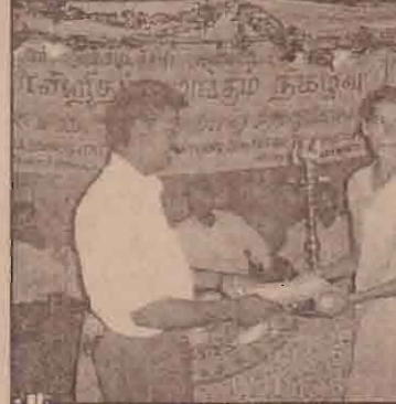
(அலுவலக செய்தியாளர்) மன்னார் மாவட்டத்தில் தமிழர் புனர்வாழ்வுக் கழகத்தினால் நடைபெற்ற படுத்தப்பெற்று வரும் கண்ணிப் பயிற்சி நிலையத்தின் முதலாம் கட்ட மாணவர்களுக்கு கான சான்றிதழ் வழங்கும் வைபவம் கடந்த 19ஆம் திகதி நடைபெற்றது.

முறைப் படுத்தப்பெற்று வரும் கண்ணிப் பயிற்சி நிலையத்தின் முதலாம் கட்ட மாணவர்களுக்கு கான சான்றிதழ் வழங்கும் வைபவம் கடந்த 19ஆம் திகதி நடைபெற்றது.