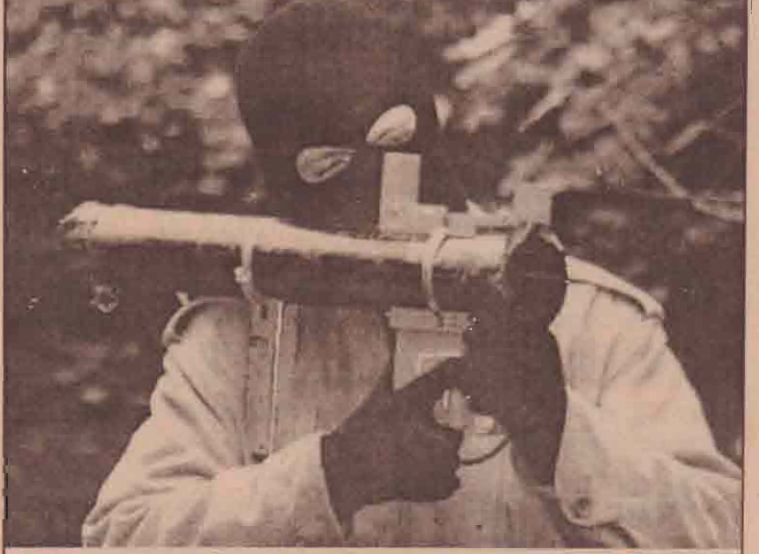
அரசாங்கம் அதிகாரப் பகிர்வுக்கு சாதகமான சமீக்கை கோட்டியதால் ஆயுதங்களைக் கீழே வைக்க வட அயர்லாந்து போராளிகள் உறுதியளித்திருப்பினும் அதில் மீண்டும் சந்தேகம் எழும்பியுள்ளதால் தமது ஆயுதத்துடன் உசார் நிலையில் இருக்கும் அயர்லாந்துப் போராளி.

(புதுடில்லி) சராக்கின் புனர்மைப்பு, மற்றும் புனர் வாழ்வு நடவடிக்கைகளுக்கென சிங்கப்பூர் இராணுவ வீரர்களையும், பாரிய விமானங்களையும், கூடற்படை கப்பல்களையும் அனுப்பவுள்ளது. அமெரிக்க சனாதிபதி புஷ் சிங்கப்பூருக்கு மேற்கொண்ட விஜயத்தைத்தொடர்ந்து சிங்கப்பூர் பிரதமர் இதற்கான இணக்கத்தைத் தெரிவித்துள்ளார். சிங்கப்பூரின் டைம்ஸ் பத்திரிகை செய்தி வெளியிடுகையில் திங்கட்கிழமை முதலாவது குழுவின் பிறப்படுவர் எனவும், அவர்களை வழி அணுப்பும் நிகழ்ச்சிகள் திட்டமிடப்பட்டுள்ளதாகவும் தெரிவித்துள்ளது.