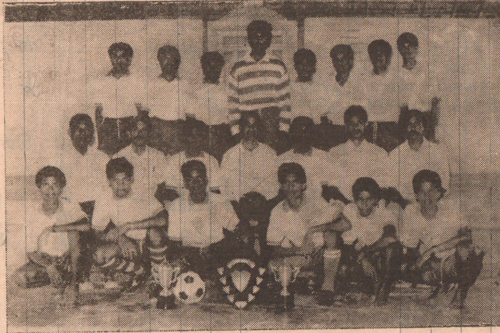
17 வயதிற்குக் கீழ்ப்பட்ட உரும்பிராய் இந்துக்கல்லூரி அணி