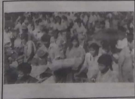
கவனத்தைப் பெரிதும் கவரவில்லை. இதன் விளைவாக சிறிதளவு அரசு

ஆனால், இந்தக் கருத்து ஐக்கிய நாடுகள் சபையினரின்