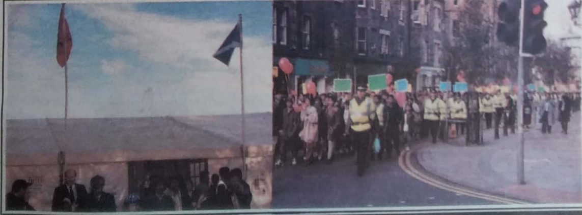
எடின்பரோ பொதுநலவாய மாநாடு - 97, ஸ்கொட்லாந்து கொடியும், தமிழ்த் தேசியக் கொடியும், பேரணி மீல் பங்கெடுத்த மக்களின் ஒரு பகுதியினரும்.....