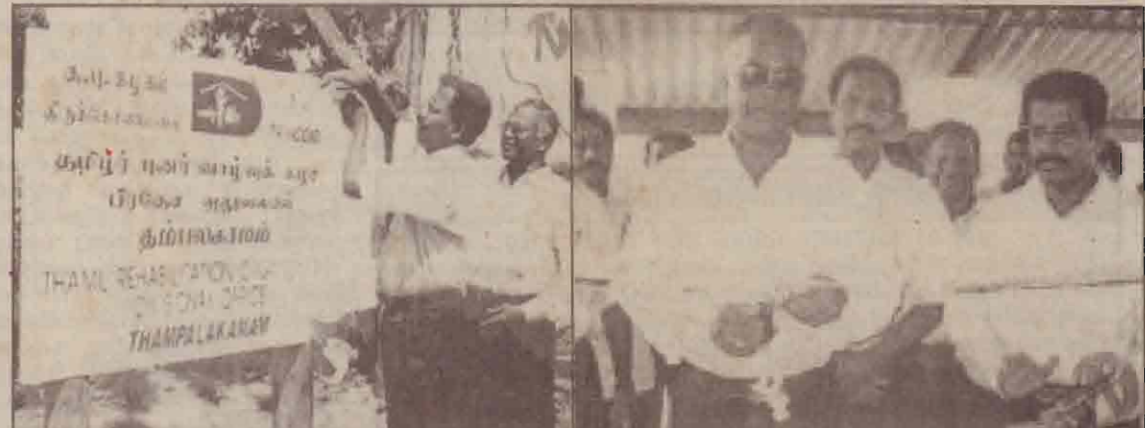
தம்பலகாமம் தமிழர் புனர்வாழ்வுக் கழக பிரதேச அலுவலகத் திறப்பு விழா நிகழ்வு