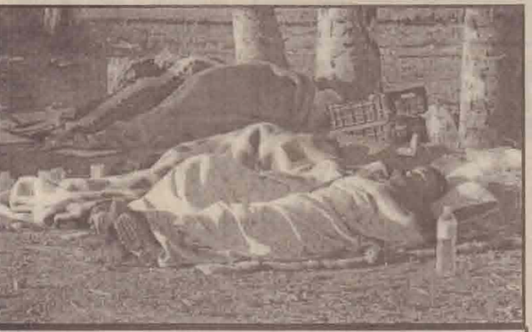
பாரிய நெருக்கத்தில் பாதிக்கப்பட்ட அல்ஜீரியாவின் போமென்டொஸ் பகுதியில் வெளியொன்றில் படுக்துறங்கும் அல்ஜீரியர்கள்.

அவர் பேட்டி அளிக்கையிலேயே இதனைக் கூறியுள்ளார். பேச்சுவார்த்தைக்கு வருமாறு பாகிஸ்தான் பிரதமர் ஜமாலி அழைத்திருப்பதைத் தெரிவித்த பிரதமர், உயர்மட்ட அளவிலான பேச்சுவார்த்தைக்கு உகந்த சூழ்நிலையை பாகிஸ்தான் படிப்படியாக ஏற்படுத்த வேண்டும் என்றும் கூறியுள்ளார். எல்லை தாண்டிய பயங்கரவாதத்தைத் தடுக்கவும், பயங்கரவாத பயிற்சி முகாம்களுக்கு அளிக்கப்பட்டு வரும் அடிப்படை வசதிகளையும் ரத்துச் செய்ய வேண்டும் என்று அவர் பாகிஸ்தானை கேட்டுக் கொண்டுள்ளார். அடுத்த மாதம் பிரான்ஸின் தலைநகர் பாரிஸில் நடைபெறும் ஜி-8 கூட்டத்தில் பாகிஸ்தான் சனாதிபதி முஷாரப்பும், இந்தியப் பிரதமர் வாஜ்பாயும் கலந்து கொள்ளவுள்ளார்கள் என்பதும் குறிப்பிடத்தக்கது.