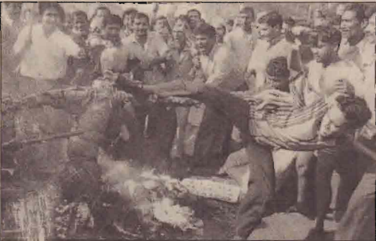
எரிந்து கொண்டிருக்கும் ஜோர்ஜ் புஷ்ஷின் உருவ பொம்மையை உதைக்கும் பங்களாதேச யுத்த எதிர்ப்பாளி.

அத்துடன் ஆக்கிரமிப்பில் ஈடுபட்டு வரும் அமெரிக்க, பிரிட்டிஷ் துருப்புக்களை கண்ட இடத்தில் அவர்களுடன் யுத்தம் செய்யுமாறு அவர் மேலும் கூறியுள்ளார். இவரின் இச்செய்தியை தகவல் அமைச்சர் முகமத் சயித் அல் சகாப் தொலைக்காட்சியில் வாசித்துள்ளார்.