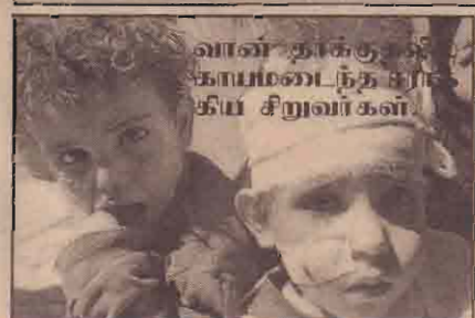
வான் தாக்குதல்களால் பலியானவர்கள்

இதுவரை அமெரிக்க கூட்டுப்படைகள் நடத்திய தாக்குதலில் 677 பேர் பலியானதாகவும் 5036 பேர் காயமடைந்ததாகவும் பாக்கித்தானியர்கள் தெரிவிக்கின்றன. ஈராக்கின் தென்பகுதியிலுள்ள அல் கில்லா நகர்ப்பகுதியில் அமெரிக்க கூட்டுப்படைகளின் தாக்குதல்களால் பெருமளவு மக்கள் கொல்லப்பட்டும் படுகாயமடைந்தும் உள்ளனர். இதனைச் சர்வதேச செஞ்சிலுவைச் சங்கம் உறுதி செய்துள்ளது. சர்வதேச செஞ்சிலுவைச் சங்க ஈராக்கிய பணியாளர்களுடன் இவ் அமைப்பின் மருத்துவம் ஒருவரும் மற்றும் பணியாளர் ஒருவரும் முதல் தடவையாக (08ஆம் பக்கம் பார்க்க)