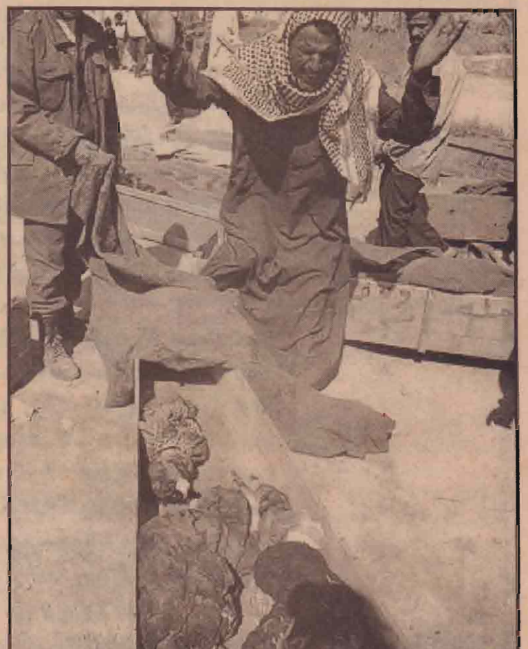
கூட்டுப் படை உலங்குவாணாதி, வாகனம் ஒன்றின் மீது நடத்திய தாக்குதலால் ஏரே குடும்பத்தைச் சேர்ந்த அறு சிறுவர்கள் உட்பட 15 பேர் பலியாகினர். ஈராக்கின் தென் மாகாணத்திலுள்ள ஹில்லா என்னும் இடத்தில் இச் சம்பவம் இடம்பெற்றது. இச் சம்பவத்தில் தனது குடும்பத்தைப் பறிகொடுத்து ஈராக்கியர் தனது குழந்தைகளின் சடலங்களைப் பார்த்துக் கதறியழுும் காட்சி.

இதுவரை அமெரிக்க கூட்டுப்படைகள் நடத்திய தாக்குதலில் 677 பேர் பலியானதாகவும் 5036 பேர் காயமடைந்ததாகவும் பாக்கித்தானியர்கள் தெரிவிக்கின்றன. ஈராக்கின் தென்பகுதியிலுள்ள அல் கில்லா நகர்ப்பகுதியில் அமெரிக்க கூட்டுப்படைகளின் தாக்குதல்களால் பெருமளவு மக்கள் கொல்லப்பட்டும் படுகாயமடைந்தும் உள்ளனர். இதனைச் சர்வதேச செஞ்சிலுவைச் சங்கம் உறுதி செய்துள்ளது. சர்வதேச செஞ்சிலுவைச் சங்க ஈராக்கிய பணியாளர்களுடன் இவ் அமைப்பின் மருத்துவம் ஒருவரும் மற்றும் பணியாளர் ஒருவரும் முதல் தடவையாக (08ஆம் பக்கம் பார்க்க)