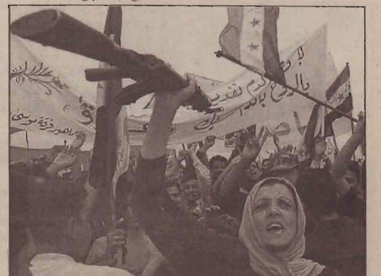
பாக்தாத்தில் நடந்த கூட்டம் ஒன்றின் போது "கலாஸ்கன்" ரக ரைபிள் ஒன்றை அசைத்துக் காட்டும் ஈராக்கிய பெண்.

அமெரிக்காவின் நோக்கங்கள் நிறைவேறாமல் செய்யமுடிந்தால் அது ஈராக்கிற்கு வெற்றியைத் தருவது போலாகும் என அரபுலக செய்மதி வானொலி ஒன்றுக்கு அளித்த பேட்டியில் துணைப் பிரதமர் கூறியுள்ளார்.