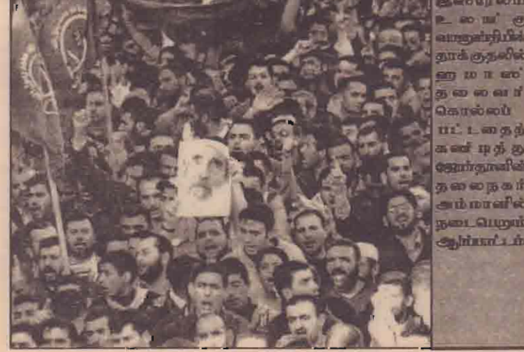
காணாவில் இஸ்ரேலிய உலகக் குவானூர்தியின் தாக்குதலில் ஹமாஸ் தலைவர் கொல்லப்பட்டதைக் கண்டித்து மேற்குக்கரை நகரில் ஆர்ப்பாட்டம்.

வியட்னாம் மீன்பிடித்துக் கொண்டிருந்த 8வெள்ளாட்டுக் கப்பல்களையும் அதன்மாலுமிகளையும் வியட்னாம் அதிகாரிகள் சுற்றிவளைத்து தடுத்து வைத்துள்ளனர். கைது செய்யப்பட்டவர்களில் 40பேர் தாய்வாளைச் சேர்ந்தவர்கள் எனவும் 20பேர் மியன்மார் பிரஜைகள் எனவும் தெரிவிக்கப்படுகிறது. இவர்கள் விசாரிக்கப்படுவதாகக் குறிப்பிட்டவியட்னாம் இயக்கங்கள் எங்கே தடுத்து வைத்துள்ளது என்பதைக் கூற மறுத்துள்ளது.