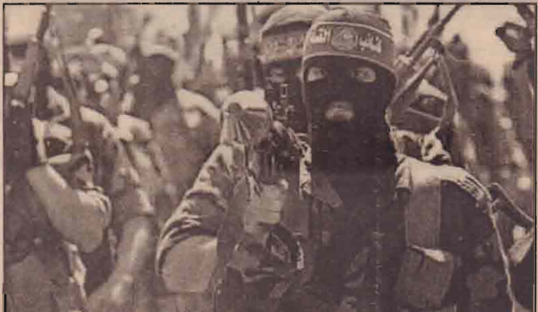
ஹமாஸ் இயக்கத்தலைவரின் இறுதிக் கிரியையில் கலந்து கொள்ளச் செல்லும் பலஸ்தீனர்கள் ஆயுதங்களுடன்..