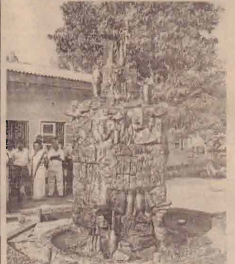
யுத்தகால நினைவுத் தூபி

* கிளி, மருத்துவமனையின் யுத்தகால அழிவை நினைவு கூர்ந்து அமைக்கப்பட்ட தூபி திறக்கப்பட்டது.