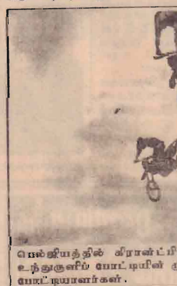
பெஷ்சிற்றுத்தில் கிரான்ட்பிரீக்ஸ் உலகக்கிண்ணத்துக்கான உந்துகளில் போட்டியின் முதல் சுற்றில் கலந்து கொள்ளும் போட்டியாளர்கள்.

ஆனாலும் பயங்கரவாதக் குழுக்களிடமிருந்து தம்மைப் பாதுகாத்துக்கொள்ளும் உரிமை இஸ்ரேலுக்கு உண்டென்றும் அது கூறியுள்ளது.